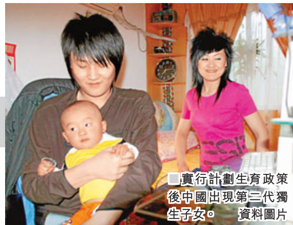
■ 實行計劃生育政策後中國出現第三代獨生子女。 資料圖片