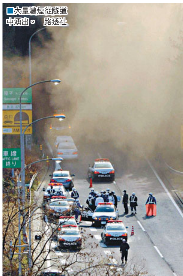
大量濃煙從隧道湧出。