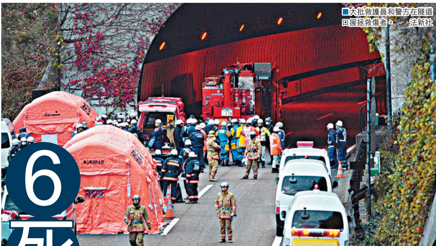
大批救護員和警方在隧道回援拯救傷者。