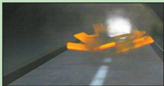
上層天花突然崩塌，壓毀車輛起火

隧道全長約4.7公里，分上、下兩層管道，各兩線行車。在開往東京方向管道，距離隧道口約2公里處出事