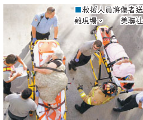
救援人員將傷者送離現場。