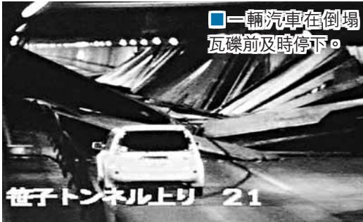
一輛汽車在倒塌瓦礫前及時停下。

日本山梨縣昨早發生隧道坍塌事故，至少3輛車被瓦礫壓着引起火災，並冒出濃煙，造成至少6人喪生及3人受傷。警方先在隧道一輛客貨車內發現5具焦屍，由於環境惡劣，難以確定何時移出屍體及救出其他被困人士。救援人員晚上再在隧道內發現多一名男子，救出時證實死亡。專家懷疑事故與隧道支撐頂板的支柱老化有關。隧道的營運公司昨晚稱，管道內用以固定天花頂板的鋼材過去35年來不曾更換，公司社長早前就事故向公眾道歉。