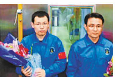
兩名研究員在密閉艙內進行為期30天的科學試驗後順利出艙。

實現遠距離或長時間的載人深空探測、地外星球定居，首先要保障的就是航天員的人體循環。此前神舟飛船和天宮一號目標飛行器均使用高壓氧氣瓶供氧或電解製氧，以維持航天員生命，至於淨化航天員呼出的二氧化碳則使用化學藥劑等完成。