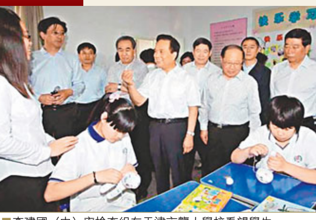
■李建國(中)率檢查組在天津市聾人學校看望學生。

在天津工作時, 教師出身的李建國就十分關心這所學校的發展。這次來津考查, 李建國專程來到該校, 認真聽取了師生學習、生活、工作的情況介紹。他向默默無聞工作在這裡的187位特殊教育工作者表示感謝, 並饒有興致地觀摩了一堂發聲訓練課, 觀看了一場聾啞學生的文藝演出。