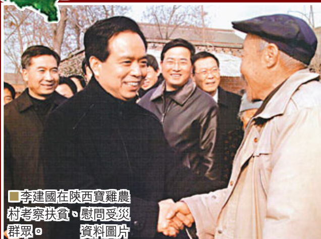
■李建國在陝西寶雞農村考察扶貧、慰問受災群眾。資料圖片