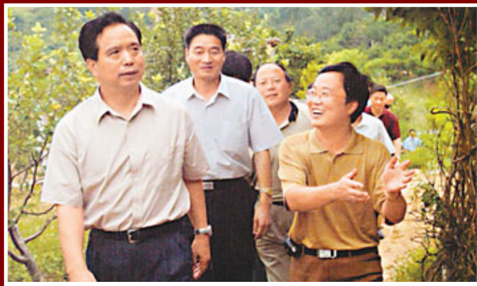
■李建國主政陝西期間, 就有「民生書記」之稱。圖為李建國在陝西旬陽老龍溝養生生態示範範圍考察。資料圖片

香港文匯報訊 (記者 張仕珍 西安報道) 1997年, 李建國從天津調任陝西省委書記, 直到2007年赴山東擔任省委書記, 李建國在陝西一待就是10年。在陝10年間, 李建國常說, 有人說從地圖上看陝西, 特像一尊蹲着的秦兵馬俑, 「但我心裡想得最多的是如何讓他盡快站起來」。