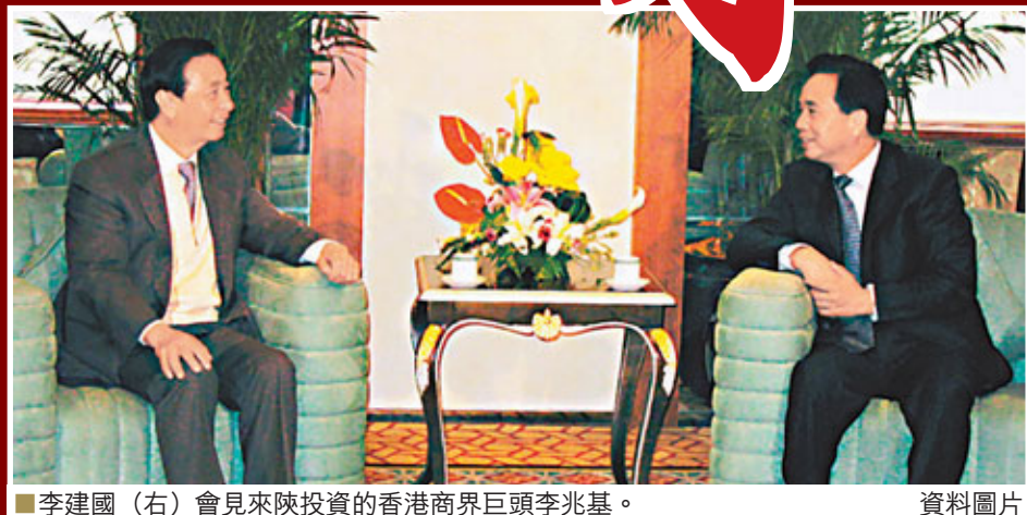
■李建國(右)會見來陝投資的香港商界巨頭李兆基。