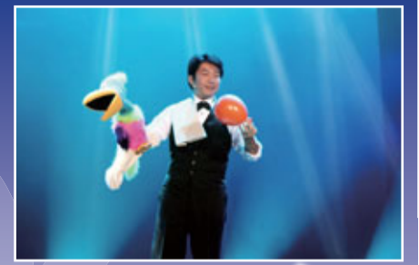
■ 中國台灣魔術師劉成的腹語真人秀讓觀眾歡笑不停。