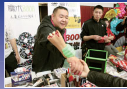
■ 魔術道具展上，魔術師在與觀眾互動。

主辦：文化部 中國文聯 北京市人民政府 承辦：文化部藝術司 中國雜技家協會 北京市文化局 北京市文資辦 北京市文聯 北京演藝集團 北京昌平區人民政府 協辦：文化部中外文化交流中心 亞洲魔術聯盟 北京雜技家協會 中國雜技團