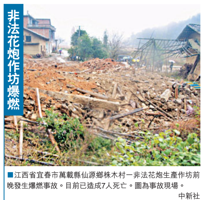
■ 江西省宜春市萬載縣仙源鄉株木村一非法花炮生產作坊前晚發生爆燃事故。目前已造成7人死亡。圖為事故現場。

「發現這個金礦，驗證了地質專家多年來預測的棲霞深部存在大礦、特大礦的理論。」棲霞市國土部門有關負責人介紹，這次發現的金礦儲量已經達到國家規定的大型金礦儲量標準，儲量超過20噸。