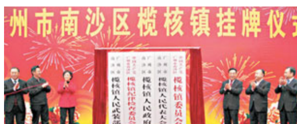
■ 大崗、東涌、欖核三鎮1日起正式由番禺劃入南沙新區。

廣州番禺區區長樓旭達表示，按照行政職責和有關政策規定，番禺和南沙各職能部門要在12月15日前簽訂部門交接協議書。兩區還達成共識，要確保三鎮群眾享受的福利待遇「就高不就低」，享受的制度「就好不就差」。比如，三鎮戶籍的初中應屆畢業生，在五年過渡期內可按移交前政策，繼續報考番禺區屬普通高中和示範性高中；三鎮參加新農合、醫保及公費醫療的，在五年過渡期內，可按移交前政策，繼續享受番禺區屬醫院的優質醫療服務等等。