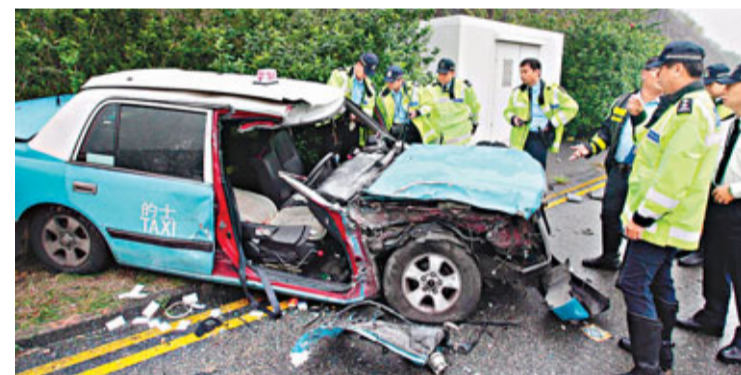
在翔東路車禍身亡司機之大嶼山的士嚴重毀壞。