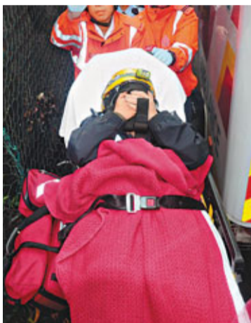
弑夫少妻被捕後遭蒙頭送院檢驗。