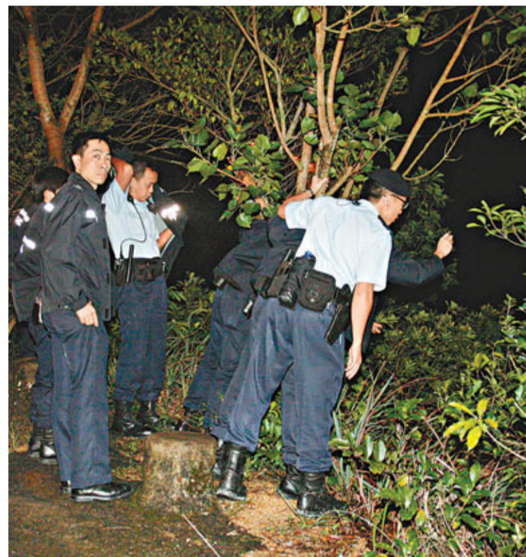
警方機動部隊警員漏夜在慈雲山搜索被困峭壁的弑夫女疑兇。