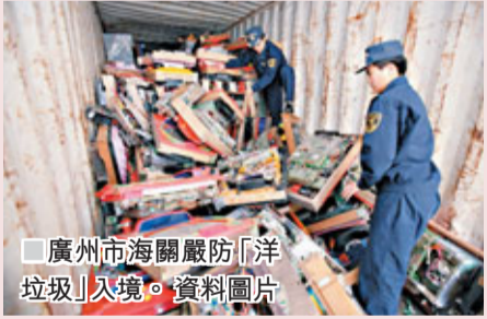
■廣州市海關嚴防「洋垃圾」入境。

中國政府對危險廢物的越境轉移，一直採取嚴厲禁止態度。根據《中華人民共和國刑法》第一百五十五條規定，逃避海關監管將境外固體廢物運輸進境的，將以走私罪論處。不過，近年中國部分地區從境外轉移污染的事件仍時有發生。有中國學者分析說，大致而言，外國主要透過以下方式向中國輸出有害廢物：