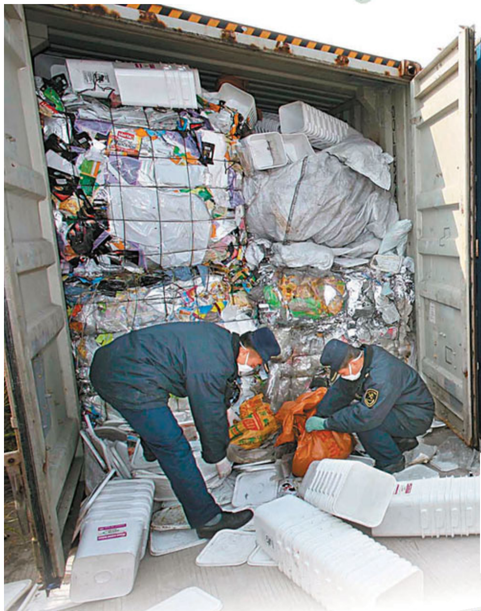
■中國自加入世界貿易組織後進口大量「洋垃圾」。資料圖片