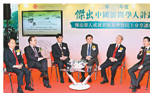
香港理大的「傑出中國訪問學人計劃」,昨安排了分享講座。

香港文匯報訊(記者 高鈺) 香港理工大學近日展開2012年度「傑出中國訪問學人計劃」,該校昨舉行典禮以表揚今年應邀訪港的6位為中國科學院或中國工程院院士的內地傑出學人,主辦單位更特別安排分享講座,以「面向第三次工業革命的大學教育」為題,讓一眾院士就大學教育未來的發展發表意見。