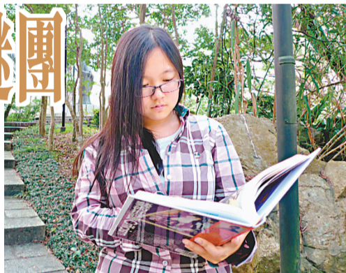
佳樂喜歡拆解那些會難倒她的知識,更喜歡為自己設謎題和解謎題。

也許是喜歡解謎團,所以她尤其偏愛魔術和偵探小說,「我覺得這些都很神奇,明明真相就在那裡了,但總能以一些花招把它掩蓋過去」。此外,她亦喜歡為自己設謎題,例如如何提高「走堂」的成功率,「這個想法主要是運用了『視覺錯位』的概念,當學生坐在老師2點鐘的位置,3個代人點名的同學,1個坐在前一排的中間,2個坐在後一排的左、右位置,然後3位同學要穿同一色系的衣服,但不