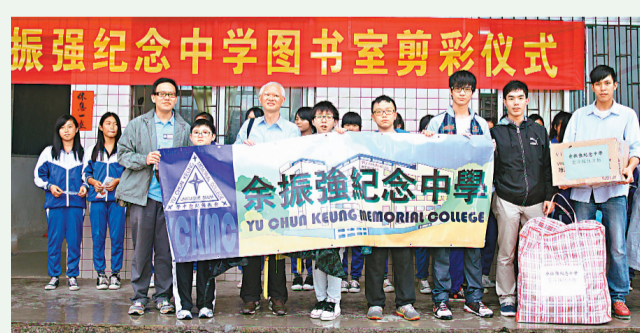
余振強紀念中學師生、家長一行90多人於本月中到廣東省雲浮市進行助學交流。

香港文匯報訊(記者 歐陽文情) 今次該校到訪了茶洞中學,獲該校師生熱情接待,余振強紀念中學醒獅隊亦冒雨作了精彩的舞獅表演,以示感謝。茶洞中學校長黃桂元代表全校師生感謝余振強紀念中學師生、家長捐助圖書室,並向該校致送錦旗。交流團隨後亦參觀了該校新建成成的「余振強紀念中學圖書室」。