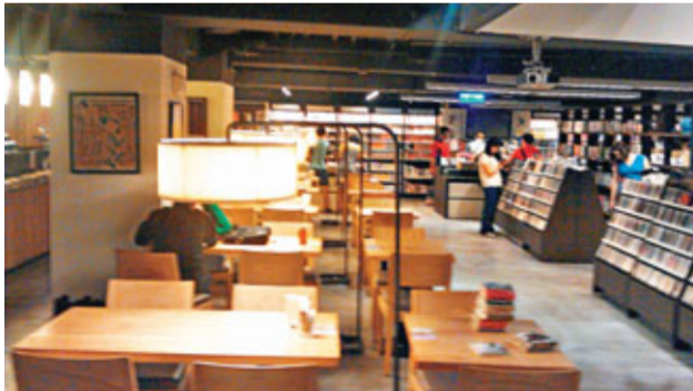
茉莉書店店內景觀。

傅：都是和書有關的，沒甚麼不同。我講過個笑話，以前出了太多賣不掉的書啊，造孽啊，現在剛好來補一補，以前製造新書，現在就想辦法賣掉舊書。