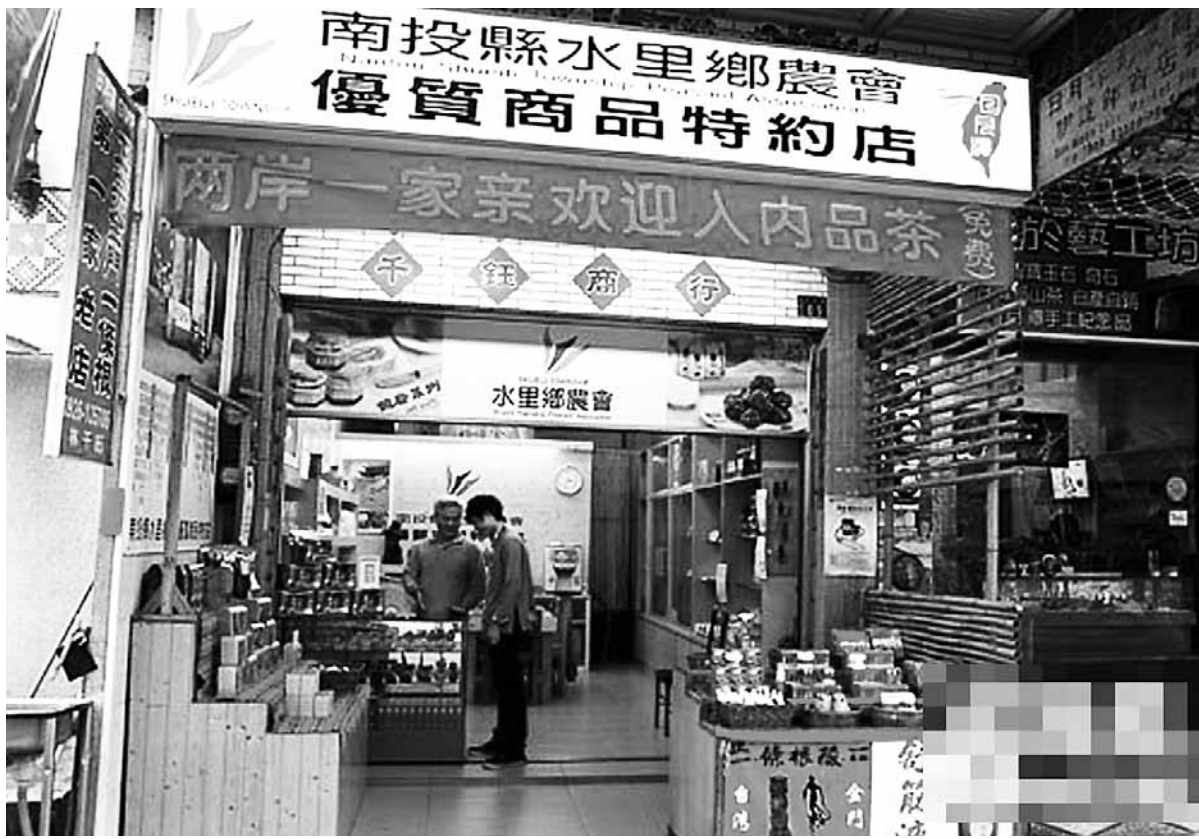
「九二共識」達成20周年，兩岸關係取得了巨大的進展。圖為南投縣歡迎陸客來台購物。

馬英九說：「『九二共識』的出現不是口頭的，不是憑空的，是白紙黑字，是函電往來……『九二共識』不應該是一個政治符號，而是一個歷史事實。」他指出，