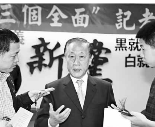
新黨主席郁慕明表示，兩岸關係走到現階段，台灣應主動對大陸開放。

郁慕明說，有人疑慮陸資「侵台」，做生意的人最精，沒錢賺陸資也不會來台灣，台灣正處於錢流失人出走的危機，大陸資金既可以活絡美國的產業，為何要限制陸資活絡台灣產業？為何不能讓大陸的專業人才為台灣所用？ 郁慕明說，當我們心態開放，對方才可以善意回應，對大陸開放，台灣人也可以去大陸工作，獲得平等待遇。台灣的營造交通等工程團隊可以去爭取大陸工程，我們主動對他們開放，大陸就會跟進。郁慕明表示，台灣沒有魄力全面開放，無法走出