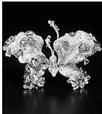
「重生蝴蝶」以超越預估價近5倍價格成交。網上圖片

香港文匯報訊 綜合報道，台灣珠寶設計師在國際發光發熱，除了被封為「麥當娜御用設計師」的胡茵菲，還有一位來自台南的趙心綺，在好萊塢女星和國際貴婦圈裡相當有名氣，光是一件珠寶作品就耗時2年，出身自建築世家的她，外祖父還是龍山寺的建築師，趙心綺的作品「重生蝴蝶」，11月中在國際知名的佳士得拍賣會上，在90秒內，拍出超過底價5倍，台幣將近3,000萬的價格，寫下華人珠寶新紀錄。