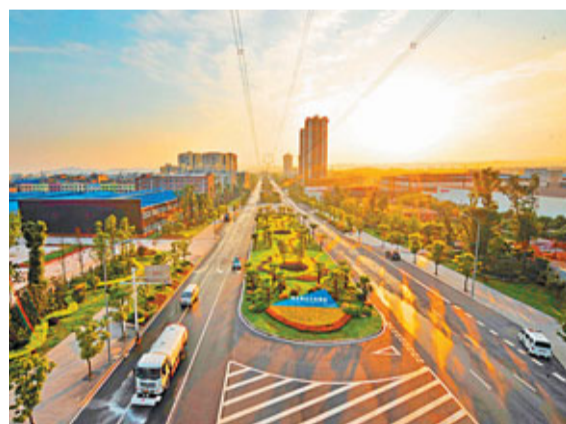
■「森林圍廠、廠在廠中、廠在林中」的璧山生態工業園。

為了提高民眾素質，璧山啟動了號召市民文明禮儀活動，既包含曝光台「看看他是誰」，又有印着「一路文明風，滿目和諧情」的雨傘、環保購物袋和垃圾桶，參與者人人有份。