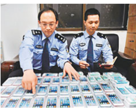
深海關嚴打「水客」，查扣值過億元私貨。香港文匯報深圳傳真

他補充指，中旅社曾考慮多種收集數碼相片方式，但為保障個人私隱和系統安全，故採取較保守的光碟。「互聯網外傳相片涉及保安問題，個人資料可能外洩，加上現時未有網上辦證服務，擔心會出現身份核實問題，效率亦不太好。而USB記憶體有可能帶有攻擊程式，對系統破壞力遠大於光碟。」