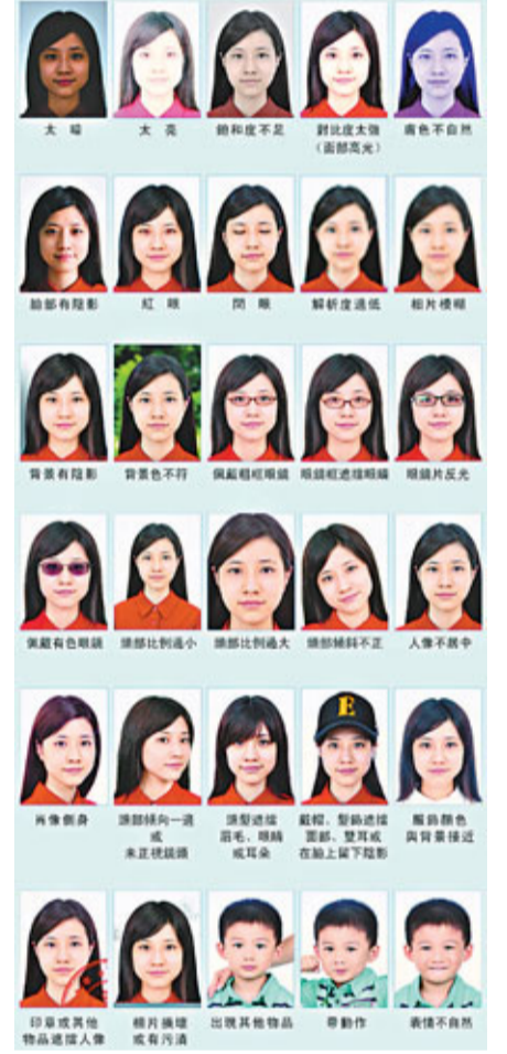
部分不合格照片示範。

據海關負責人介紹指，行動所搗破的走私網絡是一個成熟的，集貨主訂貨、香港供應商供貨、「水客」通關、境內批發銷售為一體的走私銷售鏈條。該集團「水客」走私分子把香港訂購手機經「中英街」、羅湖等口岸走私入境，之後迅速被「水貨」批發商銷