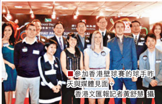
參加香港壁球賽的球手昨天與媒體見面。

隨着F1本賽季收官戰巴西站落下帷幕,43歲的舒麥加也結束了自己19年的F1生涯,再次退役。對於德國車王的離開,體壇及媒體都高度評價了這位F1乃至世界體壇的偉大男人,認為F1不能沒有舒麥加,而他的退役也意味着屬於這項運動的黃金時代也已結束。謝幕之戰,舒麥加緊隨維泰爾完賽,獲得第七名。3年,58場分站賽,一次登上領獎台,年終排名第13位,德國車王舒麥加結束了這3年並不太成功的復出。