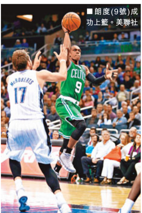
朗度(9號)成功上籃。

魔術隊在末節還曾領先7分,但全場19次失誤還是讓他們葬送好局。雷迪克和尼爾森分別拿下21分和20分。皮爾斯曾有機會在常規時間終結比賽,不過他的投籃未果,雙方帶着