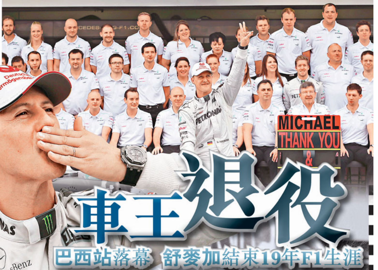
舒麥加與團隊大合照,告別F1。