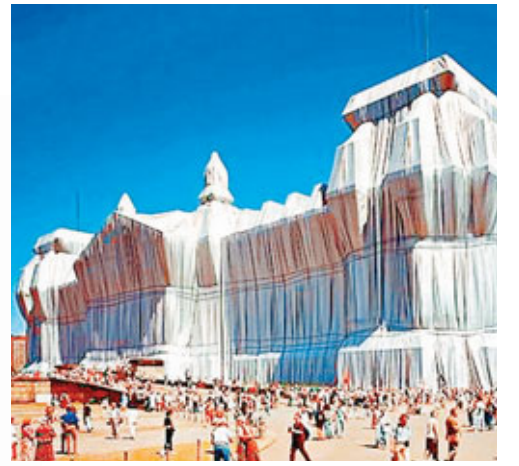
赫里斯托曾用白布包裹德國國會大樓。