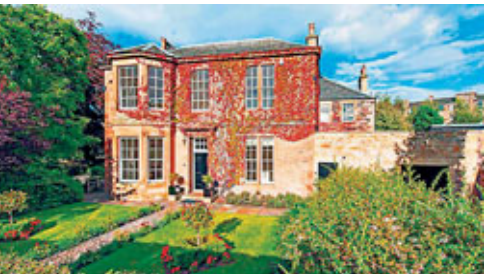
1880年維多利亞式石屋