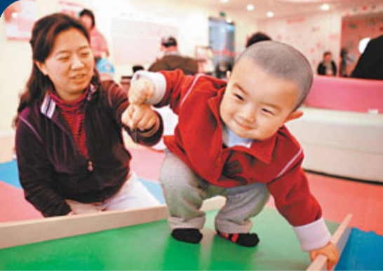
■在「一孩政策」下出生的獨生子女，是每個中國家庭的重中之重。資料圖片