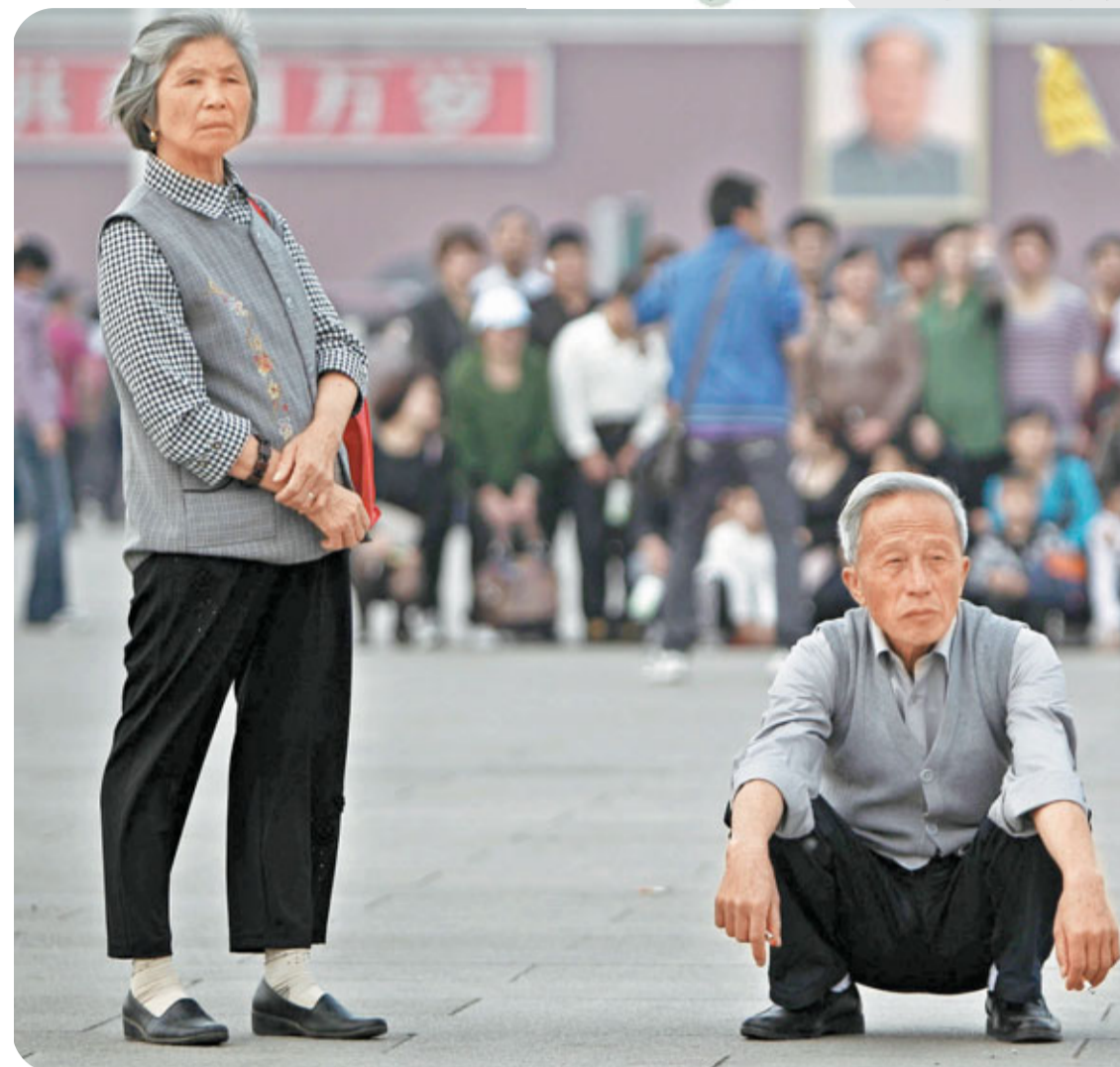
■大部分年邁的父母都需要子女的照顧。資料圖片

前段時間，一段名為《空巢一生》的中國「失獨」家庭調查視頻，在互聯網上獲得了數以百萬計的點擊率。視頻中，一對夫婦在年近六十時失去了女兒，萬念俱灰的他們只能寄居在寺廟裡，靠進行簡單的勞動來維持生活，並在那裡躲避世俗帶給他們的痛苦。還有一位年過七十的老人自己想要去養老院養老，但卻因沒有子女，院方不敢接收。同樣的情況還發生在就醫上，暫且不論失獨老人的經濟負擔能力，光是遇到手術前的家屬簽字的情況，就是一個難以解決的問題。隨後，各大媒體開始紛紛關注這個特殊群體，並通過對一個個孤獨、悲愴和絕望的生命狀態的真實展示，引起了社會各界的廣泛關注。