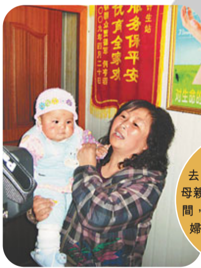
■在地震中失去獨生女，「失獨」母親內心掙扎了一段時間，才決定冒着高齡產婦風險再生孩子。資料圖片

中國目前仍然是以家庭養老為主，而對於失獨家庭，家庭養老不再可行，他們背後的支持者與照顧者由於獨生子女的去世成為空缺。那麼，究竟該由誰來贍養他們？