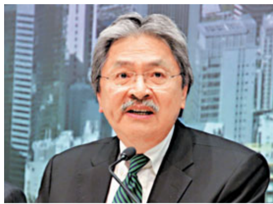
曾俊華表示，特區政府一直緊守量入為出和應使則使的原則。

香港文匯報訊（記者 鄭治祖）特區行政長官梁振英及財政司司長曾俊華，由10月底開始「行仔嘍」，聽取各界對明年初公布的新年度施政報告及財政預算案的建議。曾俊華昨日在其網誌撰文，強調