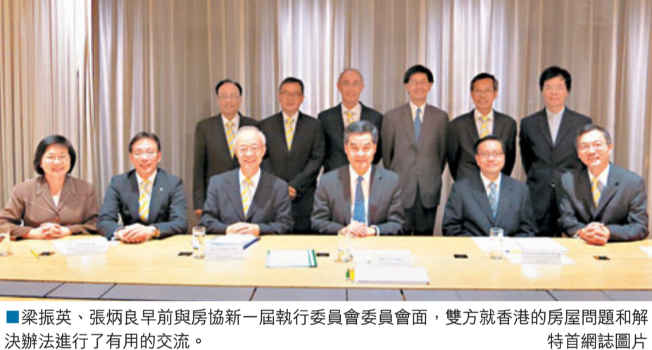
梁振英、張炳良早前與房協新一屆執行委員會委員會面，雙方就香港的房屋問題和解決辦法進行了有用的交流。

香港文匯報訊（記者 鄭治祖）房屋問題是今屆特區政府的施政重點之一。特首梁振英於日前和運輸及房屋局局長張炳良，在辦公室會見了於10月產生的房協新一屆執行委員會委員，雙方就香港的房屋問題和解決辦法進行了有用的交流。