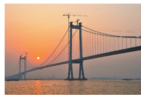
■泰州長江公路大橋昨日正式通車。

此外，泰州長江大橋創下五個「世界第一」。據江蘇省交通規劃設計院橋樑總工程師韓大章介紹，它有最新設計；最高中塔；最深沉井；最長主纜；僅有施工。