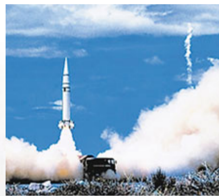
■新型直升機試飛成功。小圖為導彈發射圓滿成功。