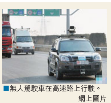
■無人駕駛車在高速路上行駛。

經過多年發展，東亞合作的目標更加明確、基礎更加牢固、內涵更加豐富。只要各方本着「咬定青山不放鬆」的精神，繼續堅持不懈地努力，東亞合作的道路就會越走越寬闊，越走越順利。