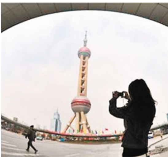
■遊客在陸家嘴拍照留念。

前灘國際商務區和陸家嘴金融城共同位於黃浦江東岸。上海市政協副主席、浦東新區區長姜傑說，「前灘可以稱之為陸家嘴的『升級版』」。具體表現在三個方面：一是更重生態文明，前灘整個區域中有約三分之一的區域用於綠化；二是城市功能更加齊備，陸家嘴金融城主要以商辦為主，前灘則包括全球化城市綜合體、國際化居住社區、媒體城、能源中心等多種功能性項目；三是國際化程度更高，前灘將建設「24小時城市」，實現與紐約、倫敦等國際金融中心的「零時差」。