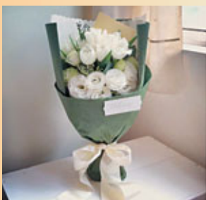
■ "My All"「念」