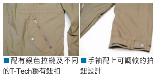
■ 配有銀色拉鍊及不同 T-Tech獨有鈕扣