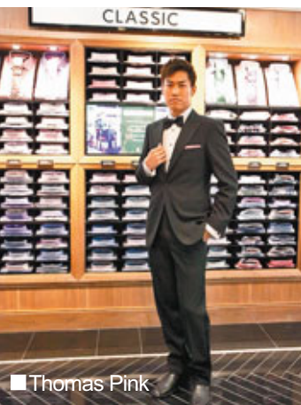
■ Thomas Pink