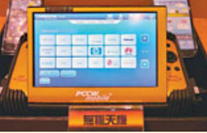
■ 有了「無限天機」裝置，轉移資料沒難度。

另外，現時轉用智能手機非常普遍，你有否覺得在使用新電話時，要將舊資料重新整理，既需時又麻煩，其實只要你利用「傾King」裝置，在PCCW門市轉換手機時，便有免費、安全而又快捷的手機資料高速直接轉移服務，可將舊手機內的個人資料在你面前點對點直接轉移至新手機，如電話簿、短訊、行事曆、相片、影片等。