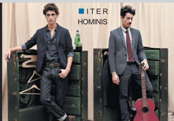
■ ITER HOMINIS