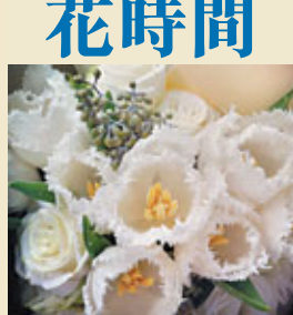
■ "My All"「念」