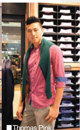
■ Thomas Pink