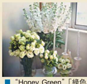
■ "Honey Green"「綠色蜜糖兒」

上星期日，剛處理完貨存事宜，從花墟回到工作室，便接到一位熟客的來電，急需一件花束訂單。了解敝公司的朋友都知，工作室向來不存貨，以確保用上最新鮮的花材。最後答允了該訂單，原因是手上的新鮮花材能夠合乎客人的要求。其次是這位客人對花藝的欣賞和尊重太令人感動了，讓我再一次和時間競賽。