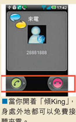
■ 當你開着「傾King」，身處外地都可以免費接聽來電。