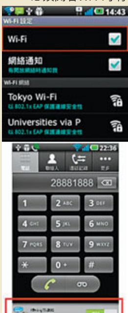
■ App下面必須開着才能打出電話