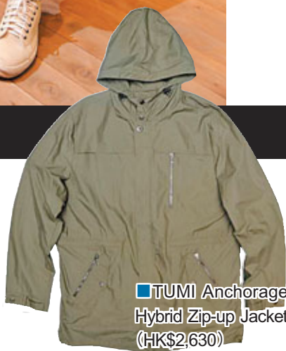
■ TUMI Anchorage Hybrid Zip-up Jacket (HK$2,630)

加上，今個秋季，海軍風又回歸了，中性外套為主，前袋設計的細節，就如以前的軍人服；藍色、軍綠為基調色，更顯硬朗與帥氣。除了經典的方格圖案外，藍染、提花針織外套等可謂是這季的新寵。