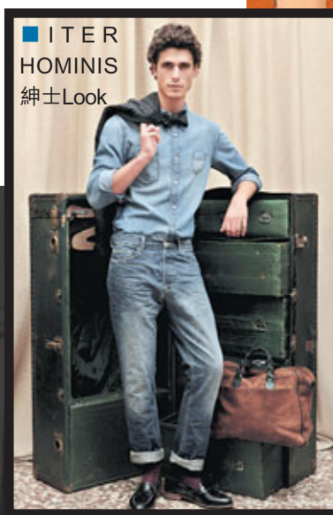
■ ITER HOMINIS

牛仔褲亦是45R每季的重點貨品，今季繼續有海比古、空比古及馬比空，用上特別的染料——日本新產的藍染，加上松煙炭之煤混合成的墨藍色。染料天然，且全人手染製。洗水褪色後的墨藍紗芯用大豆汁加工，滲透入芯，令之後再上的染料不會上色，褪色效果更快更明顯。經歲月洗