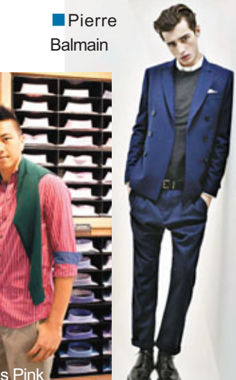
■ Pierre Balmain