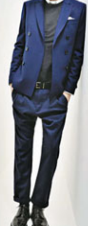
■ Pierre Balmain