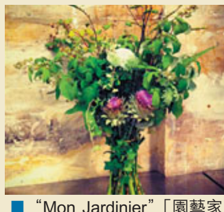
■ "Mon Jardinier"「園藝家花束」