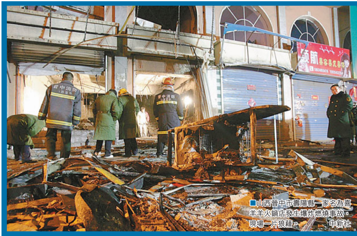
山西晉中市壽陽縣一家名為喜羊羊火鍋店發生爆炸燃燒事故,現場一片狼藉。

據調查組通報,事故原因初步判定為液化氣洩漏引起爆炸燃燒,詳細原因正在進一步調查中。