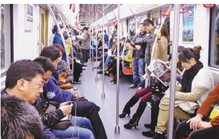
杭州地鐵首日常流井噴。

香港地鐵上蓋商業區統一由港鐵經營和管理,並且只租不售。杭州針對城市情況,也實行了大商業區地鐵沿線商舖只租不售的管理辦法,並且不能轉租。廣告經營權、公共區商舖連鎖商家租賃經營權、ATM(自動存取款機)機位租賃經營權等都以5年為租期,並且統一由港鐵接手經營管理。