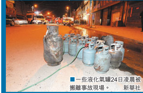
一些液化氣罐24日凌晨被搬離事故現場。