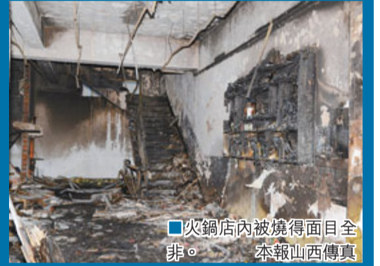
火鍋店內被燒得面目全非。