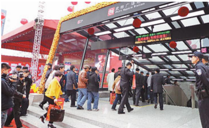
乘客進入地鐵1號線「武林廣場站」。