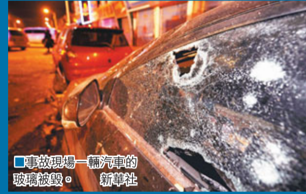
事故現場一輛汽車的玻璃被毀。