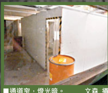
■通道窄，燈光暗。