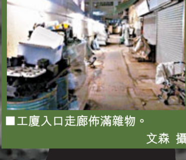
■工廈入口走廊佈滿雜物。

現時丟空的工廈單位不計其數，由於租金平加上交通便利，往往吸引新興行業承租。然而，當中涉及的改裝，若違反地契及消防條例，隨時發生意外。據了解，在眾多進駐空置工廈的行業中，以標榜「節奏快、刺激大」的室內野戰場數量最多，可以說分佈在全港各區。