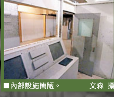
■內部設施簡陋。