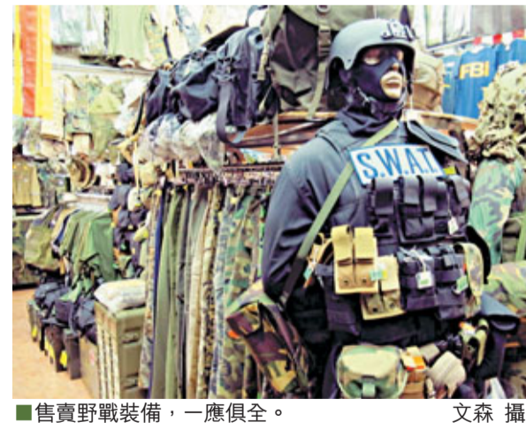
■售賣野戰裝備，一應俱全。