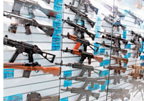
■買上佳野戰氣槍，只需數百元。