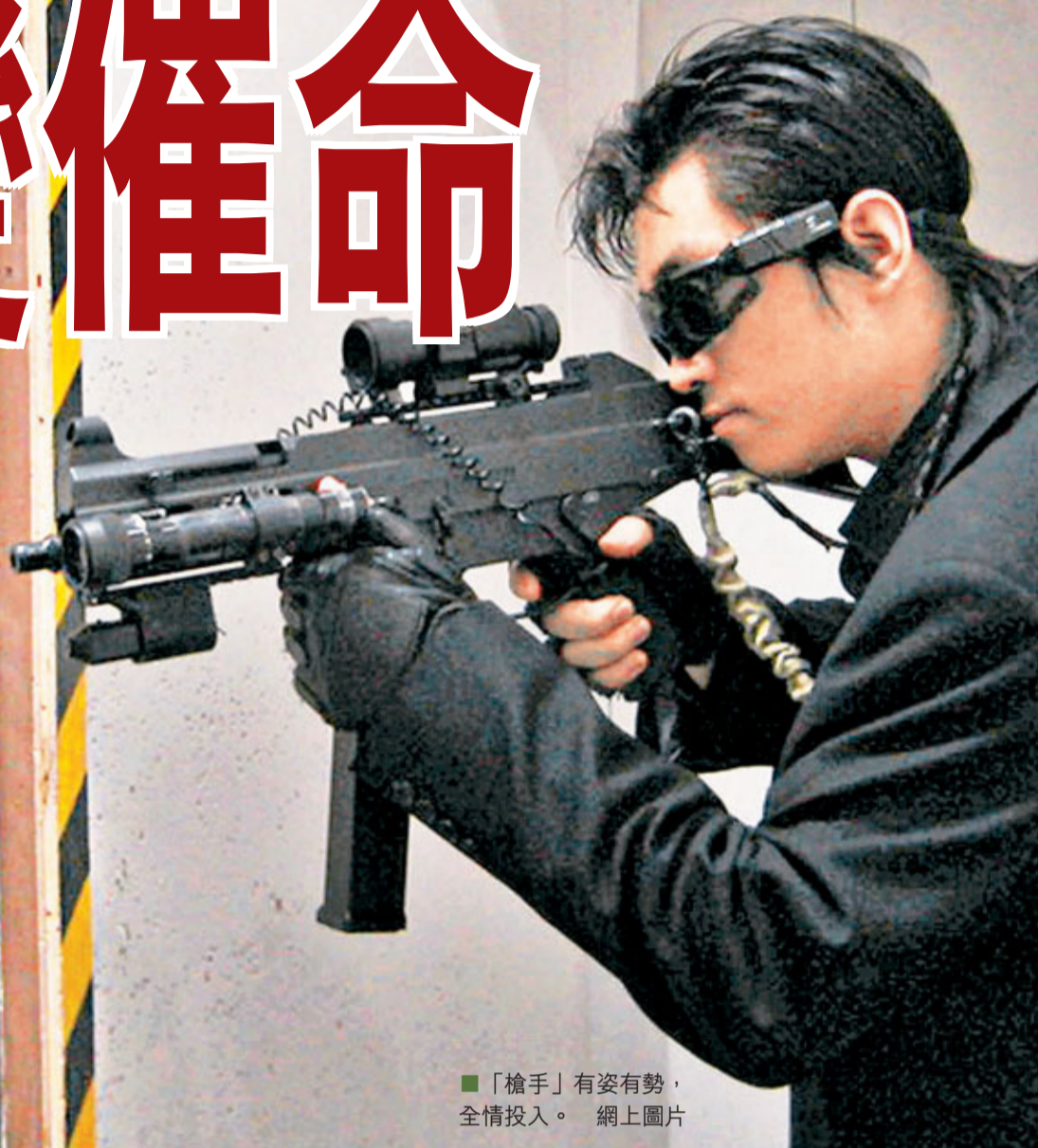
「槍手」有姿有勢，全情投入。