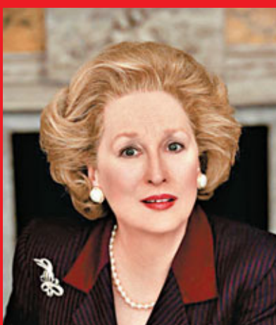
■ 梅麗史翠普參與演出的《鐵娘子》叫好又叫座。