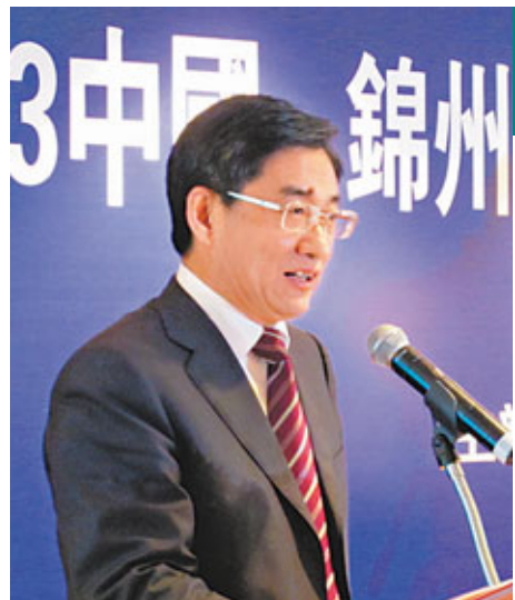
錦州市市長劉鳳海。

中華煤氣、世貿集團、華潤集團、沿海集團、北控水務集團、香港盛大集團、恒基兆業、恒大集團、嘉年華國際控股、遠洋地產等多家企業參與了此次對接會。