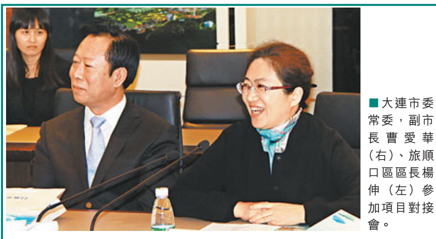
大連市委常委、副市長曹愛華(右)、旅順口區區長楊仲(左)參加項目對接會。

談及綠色食品產業時，楊仲指出，當地獨特的地理位置、適宜的生態環境，使旅順在發展綠色食品產業上具有得天獨厚的條件，目前正在全力推進佔地2.06平方公里的大連綠色食品工業園的建設，積極吸引糧食、果蔬、肉製品、豆製品、海產品、調味品、海珍品等高端食品、保健品生產企業，將利用3-5年時間打造一個覆蓋大連、輻射東北的高端綠色食品產業基地。