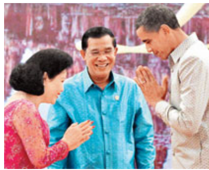
美國總統奧巴馬(右)本周歷史性出訪東南亞，當中柬埔寨一站，他表明只為參加峰會，還在閉門會議中表達

對當地民主及人權狀況的關注，令首相洪森頗為不滿。美國《投資者商業日報》報導，洪森夫人文拉妮(圖左)僅以對待僕人的方式與奧巴馬打招呼，極不尊重，質疑這或是報復奧巴馬的尖刻說話。