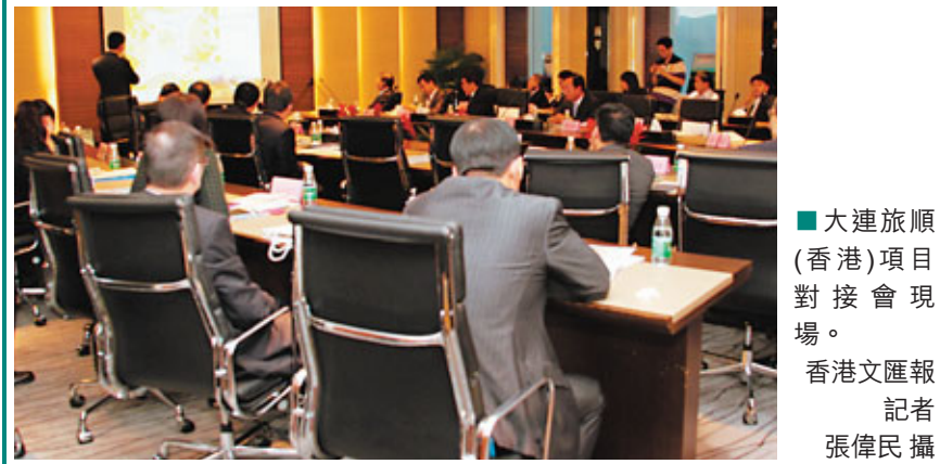
大連旅順(香港)項目對接會現場。