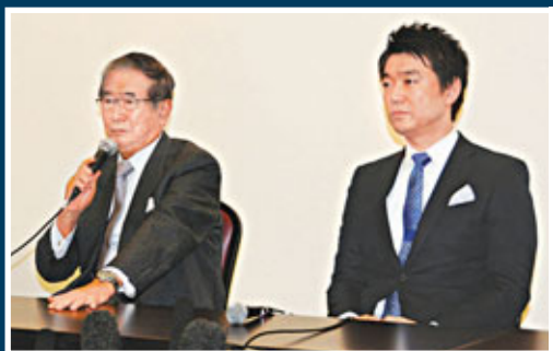
■雖然石原慎太郎(左)與橋下徹(右)同屬日本維新會，但後者對其核武論顯然有所不滿。

日本前東京都知事石原慎太郎早前提出「擁核武論」惹來激烈反響。日本《讀賣新聞》報道，「廣島縣禁止核武協會」前日遞交抗議書，要求石原收回言論。