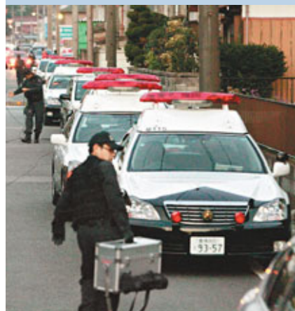
■多架警車在銀行外嚴陣以待。法新社