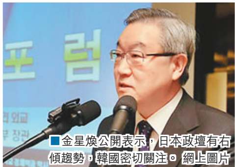
■金星煥公開表示，日本政壇有右傾趨勢，韓國密切關注。

安倍政綱主張設置日本版國家安全委員會，修憲將自衛隊定位為「國防軍」，並允許行使集體自衛權等事宜，保守色彩濃烈。韓國外長金星煥昨表示，日本就獨島(日稱竹島)等領土問題開始展現保守與攻擊性態度，必須嚴密警戒其政治右傾。