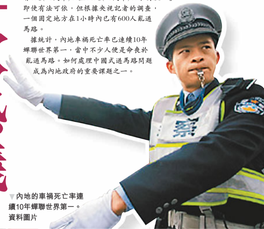
內地的車禍死亡率連續10年蟬聯世界第一。

據統計，內地車禍死亡率已連續10年蟬聯世界第一，當中不少人便是命喪於亂過馬路。如何處理中國式過馬路問題成為內地政府的重要課題之一。