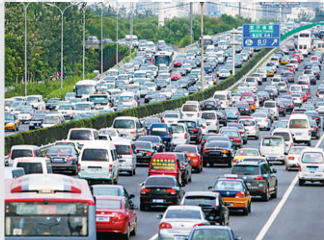
由於車輛數目不斷增加，內地交通燈的安排偏向疏導車龍。資料圖片

內地亂過馬路現象的較突出原因，除行人的觀念和素質問題外，還與交通燈安排等制度設計有關。事實上，好制度誘使壞人變好人，壞制度誘使好人變壞人。早前有報道提及2010年一名外國人在上海亂過馬路被交通警察斥責，整個過程被拍下後上載網站，紅遍網絡，可見一向被視為守法的外國人在內地亂過馬路。雖然這些個案未必能全面反映整體情況，但該現象的出現，確實值得有關部門探究亂過馬路背後的深層次原因。