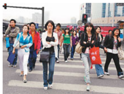
內地的交通燈等候時間太長，有人忍無可忍，寧願冒被罰款的風險而衝紅燈。資料圖片