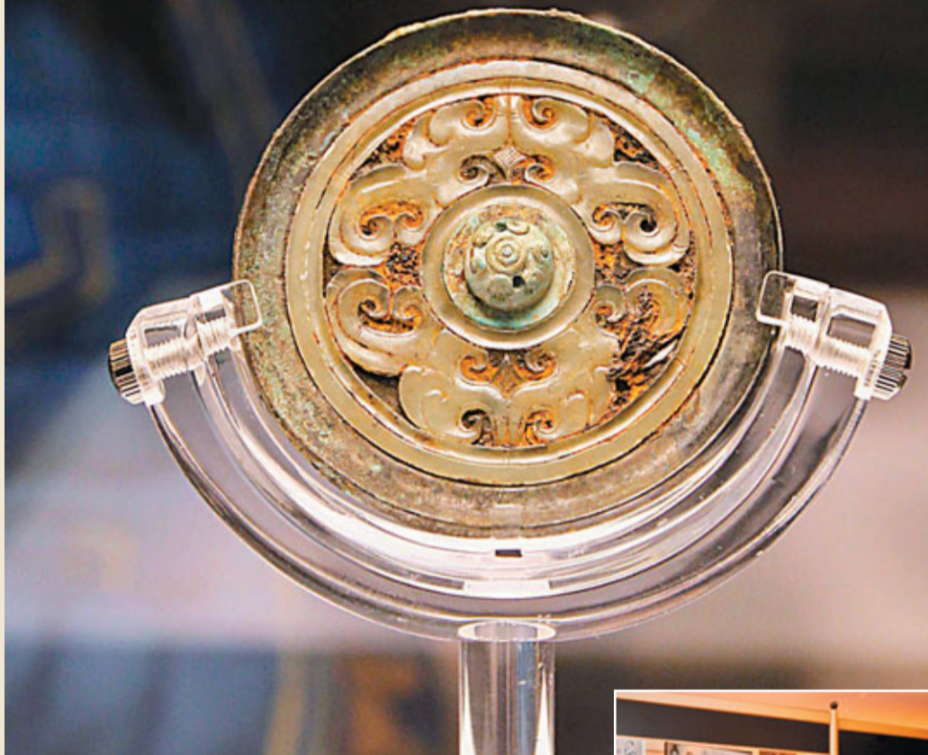
■美國收藏家捐贈中國古代銅鏡在滬展出