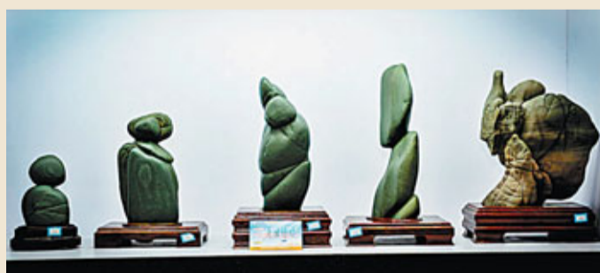
■松花石之鄉的絕美奇石