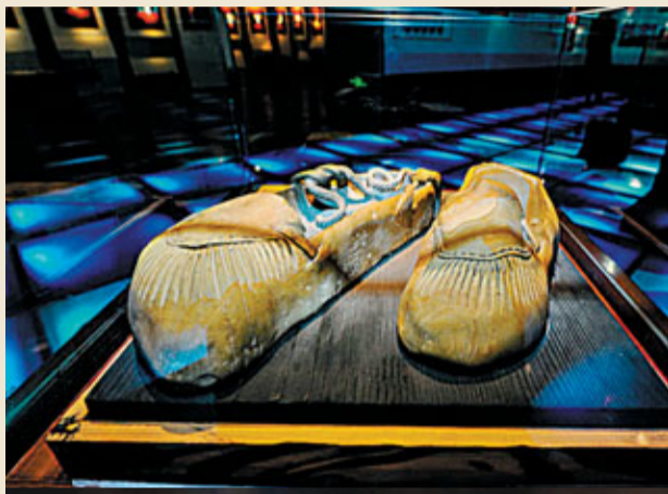
■松花石之鄉的絕美奇石，江源區松花石博物館內拍攝的雕刻成鞋模樣的松花石作品