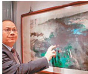
■張大千1967年畫作「谷口人家」