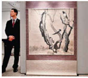
■徐悲鴻作品《野趣》

佳士得將於26及27日在香港會議展覽中心舉行中國古代和近現代書畫拍賣會，共呈獻逾700多幅精品，總估價超過3700萬美元。