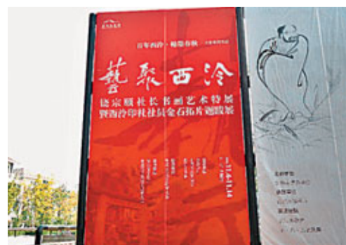
■藝聚西泠——饒宗頤書畫藝術展首度亮相杭州

「饒宗頤書畫藝術特展」是饒宗頤作品首次在杭州亮相，共有38件展品，涵蓋了他書畫藝術創作的題材和形式。國畫方面，有西北山水、取材敦煌線描人物畫的白描人物、巨幅墨荷、景物寫生等，書法作品則包括前人詩文、自作詩詞以及臨摹崖碑刻等內容。饒宗頤近十幾年創作的多幅書畫作品，皆因尺寸超過一般展館的層高，無緣與觀眾見面，到浙江美術館6號展廳就可以看了。此次展示書畫作品中最受矚目的是一張長4米多的西泠印社圖卷，蔥翠潤澤，是饒公前些年為鄧偉雄所作。業內人士紛紛表示，這些作品首次公開亮相西子湖畔，意義非凡，具有「驚心動魄」的藝術效果。為當代書畫藝術的傳古和開新提供了極具價值的模板。