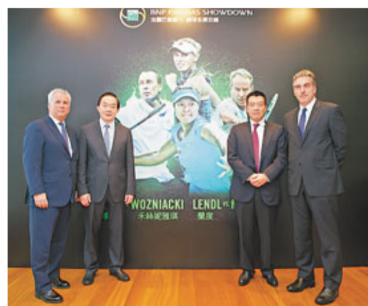
主辦單位宣布邀請得4位網壇名將明年訪港獻技。

作為國際網聯百周年紀念活動之一，首屆「世界網球日」活動將於明年3月4日在亞洲國際博覽館舉行，屆時法國巴黎銀行網球經典賽將舉行香港站的比賽，由李娜對陣禾絲妮雅琪，並重現麥根萊和蘭度之間的經典對決。