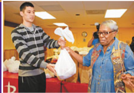
火箭球員林書豪(左)以其基金會名義，在感恩節前夕於休斯敦一間慈善中心，為100個需要幫助的家庭送上火雞和其他食物。