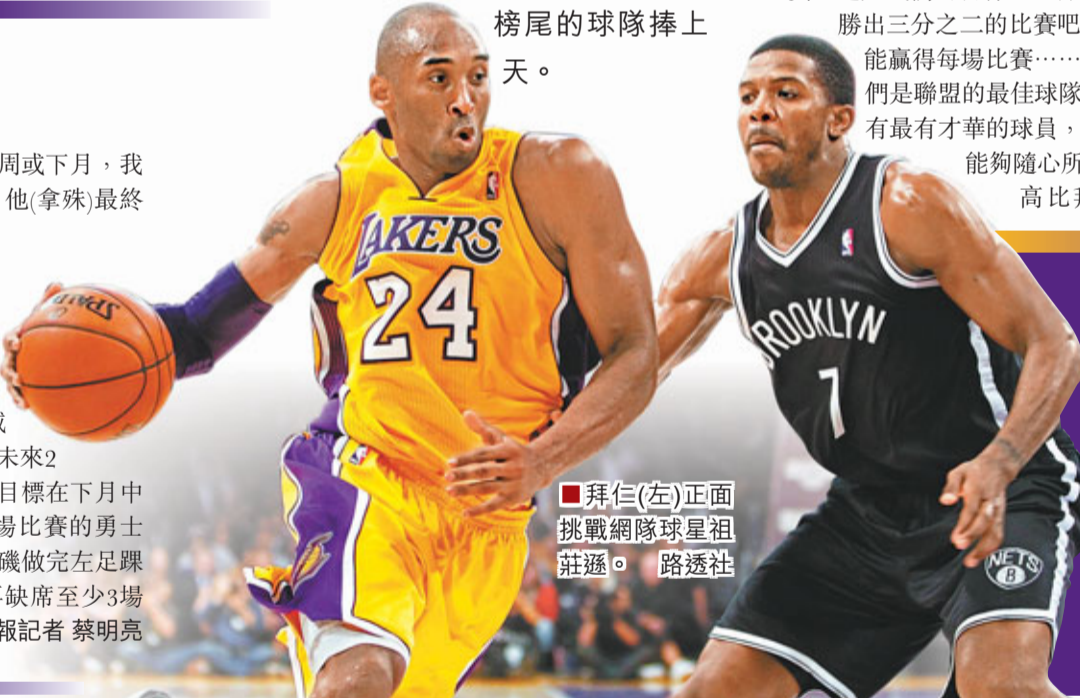
拜仁(左)正面挑戰網隊球星祖莊遜。