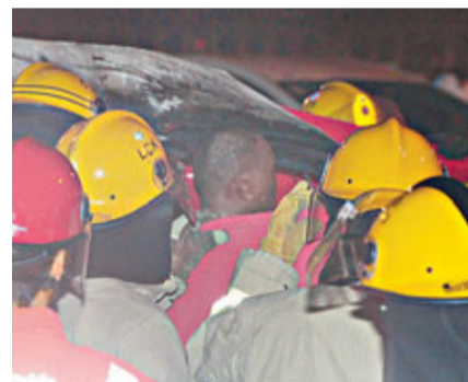
燒至焦黑的司機被消防員抬出車外。