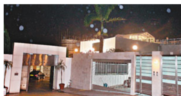
清水灣甘澗路被賊入屋劫，大屋事後證實損失財物近百萬元。

事發昨晨7時15分，61歲姓陳戶主起床後，發現露台門窗遭撬毀，屋內有搜掠痕跡，相信遭賊爆竊於是報警。初步點算損失逾430萬元財物，包括30多件古董、電腦、名錶、名牌袋及現金等。大批警員在附近山坡搜索匪蹤，並在現場對下約30多米斜坡一處山溪，發現一件象牙雕刻，經事主辨認證實是其中一件值萬多元的失物。警方相信竊匪由山坡攀越圍網入屋爆竊，得手原路離開時不慎遺下贓物。中區警區重案組已接手調查。