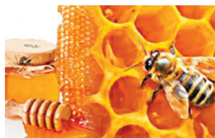
美國裁定繼續對中國產蜂蜜徵收反傾銷稅，稅率最高達183.80%。

素密切相關。商務部多次表示，冀美國政府恪守反貿易保護主義承諾，共同維護自由、開放、公正的國際貿易環境，理性妥善地處理貿易摩擦。