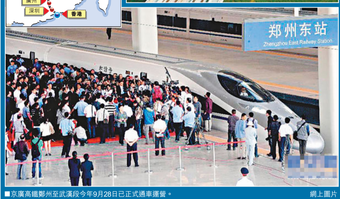
京廣高鐵鄭州至武漢段今年9月28日已正式通車運營。

石家莊至鄭州、鄭州到武漢、武漢到廣州四段。其中，最後實現通車的京石客運專線，已於9月15日進入為期約4個月的空載試運行階段。目前，京滬高鐵運營380AL高鐵路車已調運至鄭州，這也可能是未來京滬高鐵運行的車。廣鐵集團相關人士透露，目前，廣鐵方面在人員配備、硬件配套方面已經做好了準備，一些細節問題正在最後敲定。對於票價和開行數量等問題，該人士表示，目前尚不清楚，下月底待新鐵路運行圖確定後，相關信