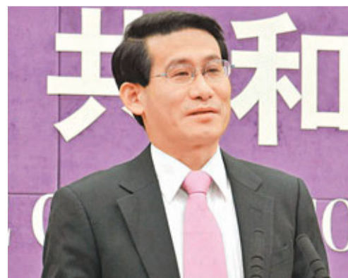
沈丹陽指出，中國10月份實際使用外資83.1億美元。

香港文匯報訊(實習記者 王微妹、記者 何凡 北京報導)商務部新聞發言人沈丹陽20日在發佈會上指出，10月當月，全國實際使用外資金額(FDI)83.1億美元，同比下降0.24%。這是連續第五個月出現負增長。而今年1-10月實際使用外資金額917.4億美元，同比下降3.45%。