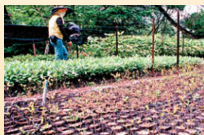
園內有很多菜園和梯田農圃