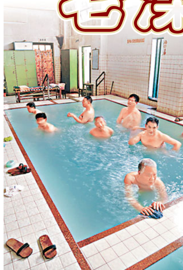
保留舊式風貌的溫泉澡堂是福州鮮活的文化記憶。