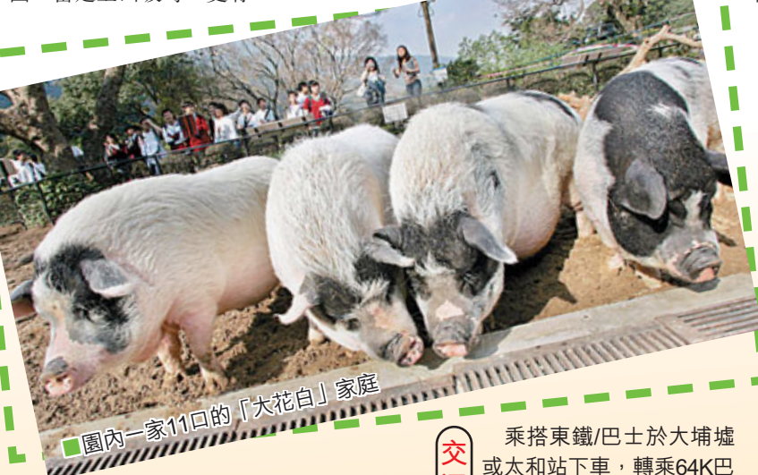
園內一家11口的「大花白」家庭

乘坐東鐵/巴士於大埔墟或太和站下車, 轉乘64K巴士往元朗西方向, 約20-25分鐘到達一段大斜路最頂處, 於嘉道理農場暨植物園門前的巴士站下車。