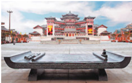
■西安大唐西市博物館是內地首家民營遺址類博物館。

中華煤氣、東亞銀行、匯豐銀行、和記黃埔、恒基兆業等一批香港知名企業入駐陝西，投資汽車製造、生物製藥、電子產品、電力能源、金融商貿等眾多行業。這些港企在推動陝西當地經濟發展的同時，也取得了良好的收益。