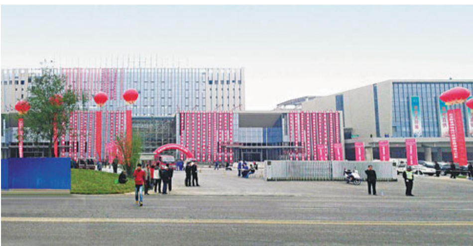
■陝西省明確提出要打造西部物流中心、全國重要物流樞紐。上圖為中國移動西北大區物流中心，下圖為西安雨潤全球農產品採購中心。