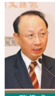
黎偉成 資深財經評論員