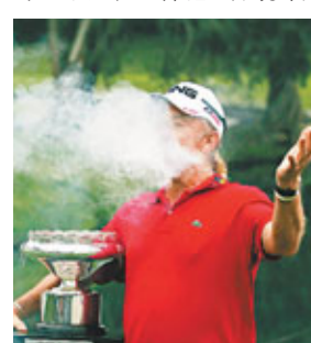
占文尼斯(左)被大埔隊長呂志興擊攔。

現年48歲的西班牙高爾夫球名將占文尼斯(見圖)昨日在香港公開賽最後一輪賽事，打出低標準桿6桿的64桿，最終以總成績低標準桿14桿的266桿奪冠，成為歐巡賽史上最年長的冠軍。另外，香港公開賽明年將被剔除出歐巡賽賽程。