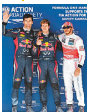
手維泰爾(見圖中)，周六在美國站排位賽做出最快圈速1分35秒657，獲排頭位出賽，而其最大競爭對手、法拉利車手艾朗素只以第9位起步，令維泰爾欲提前贏得總冠軍的機會大增。