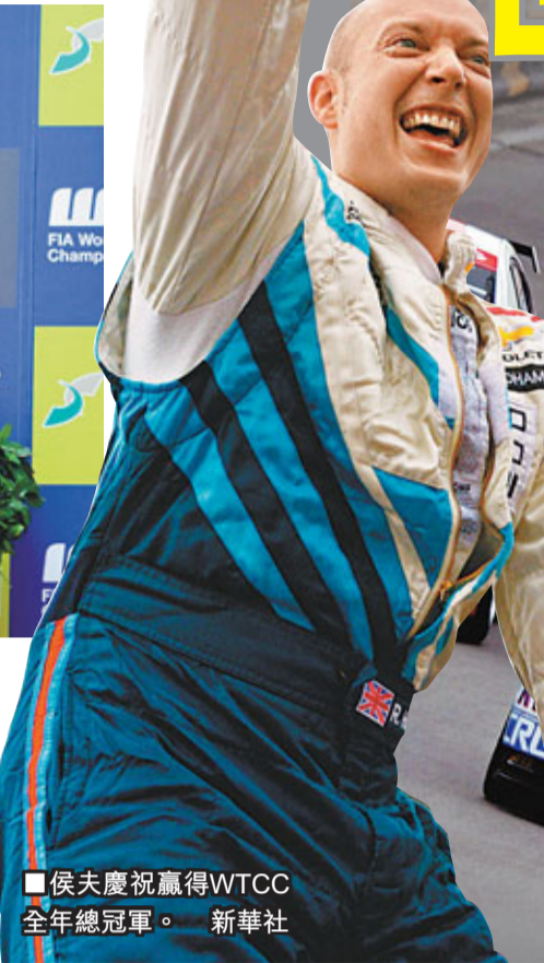
侯夫慶祝贏得WTCC全年總冠軍。

次回合，侯夫把握麥度不爾、米捷利及奧里奧拉三人先後在兩宗意外中退賽，最終以次名完成賽事，而歐陽若曦同樣受惠，再以第5位完成賽事和奪得獨立盃分站冠軍。總結整個賽季，侯夫以總成績413分，首奪世界房車錦標賽總冠軍，而贏得次回合冠軍、在澳門站取得最多積分的瑞士車手文奴，在總成績上則力保第2名。