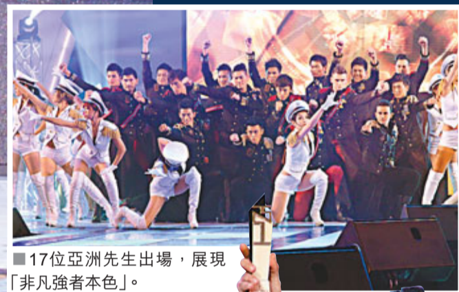
■17位亞洲先生出場，展現「非凡強者本色」。