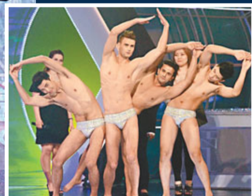
■4號魏智雄、22號亞歷士、3號薩拉迪亞、12號王凱以「發光泳褲」亮相並接受問答環節的考驗。