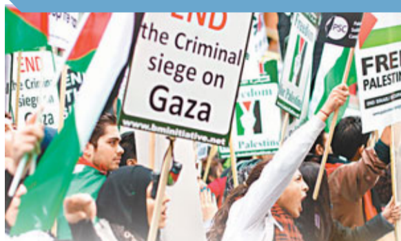
英國有數百名示威者抗議以色列轟炸加沙。

2022年世界盃主辦權前數月促成交易。款項名義上是資助2010年南非世界盃前夕的一場晚宴和研討會，但相關活動的開支遠低100萬美元。阿他拿德否認知情。 報章後來向卡塔爾申辦團隊的律師展示證據，後者承認申辦團隊曾討論有關項目，並擬訂合約，但礙於FIFA的守則最終取消交易。 ■《星期日泰晤士報》