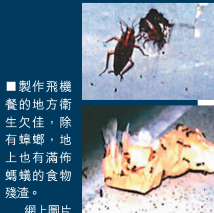
製作飛機餐的地方衛生欠佳，除有蟑螂，地上也有滿佈螞蟻的食物殘渣。

美國食品及藥物管理局(FDA)早前調查部分航空公司及其餐飲供應商，發現製作食物的區域及器具滿佈老鼠、螞蟻、蒼蠅等昆蟲，機上乘客進餐時也一併吞下細菌。 FDA的數據顯示，與其他行業相比，航空食物工業出現「重大」問題的頻率較高，過去4年更有逾1,500宗違反食物安全守則的個案。除昆蟲外，部分公司的煮食區骯髒、使用過期發霉食物，員工沒洗手等，違規情況嚴重，例如佳美航空膳食不僅沒將食物放進雪櫃，還把煮食器皿堆放在骯髒的架上，美國達美航空則發現老鼠，但公司辯稱只屬「個別事件」。