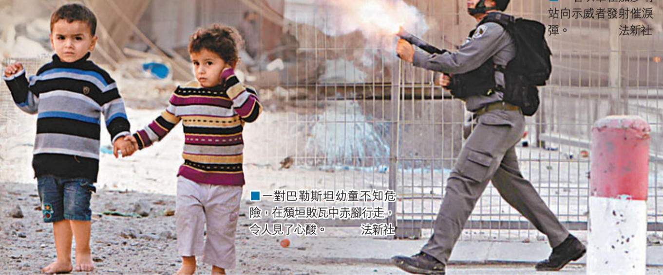
一對巴勒斯坦幼童不知危險，在頹垣敗瓦中赤腳行走，令人見了心酸。