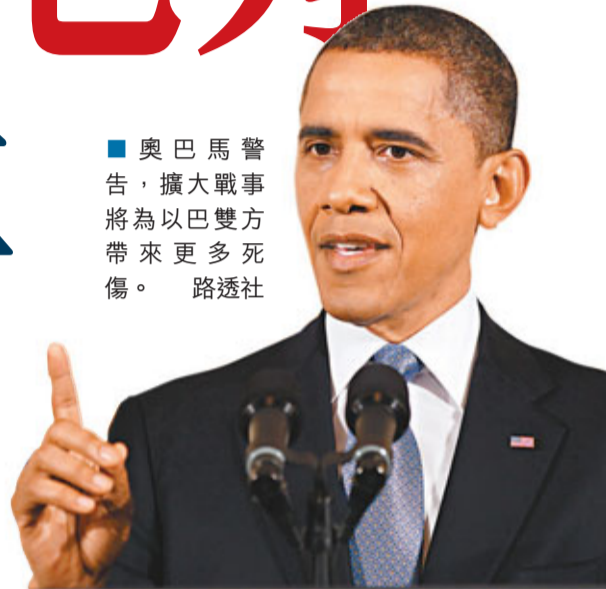
奧巴馬警告，擴大戰事將為以巴雙方帶來更多死傷。

以巴衝突昨日踏入第5天，控制加沙的巴勒斯坦激進組織哈馬斯稱，哈馬斯加沙及海外領導層在埃及協調下，已提出與以色列的停火條件，並希望停火協議能在今天前達成。不過以色列未肯罷休，總理內塔尼亞胡表示，準備「顯著擴大」針對加沙武裝分子的軍事行動，美國總統奧巴馬昨日指，以色列有權自衛，但希望以色列避免發動地面進攻。他警告，以軍一旦