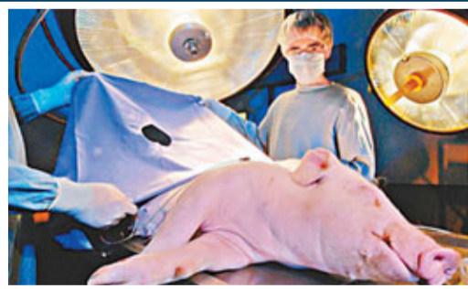
被射傷的豬躺在手術床上「待救」。網上圖片 動物權益組織PETA指責，英國和丹麥是目前北約少數仍用生豬作訓練的國家。英國國防部解釋，生豬手術提供最逼真的訓練，有關訓練一年進行兩次。■《星期日郵報》

有記者暗訪位於丹麥哥本哈根西北約48公里的北約軍醫訓練中心，發現豬隻首先進食混和麻醉藥的飼料，再被帶到森林靶場，由士兵對其器官準確地開槍，槍傷其器官但不致命，然後豬隻會被當作真人一樣「搶救」，接受長約2小時的手術。有受訓軍醫不諱言會對豬隻造成嚴重創傷，尤其肝臟。