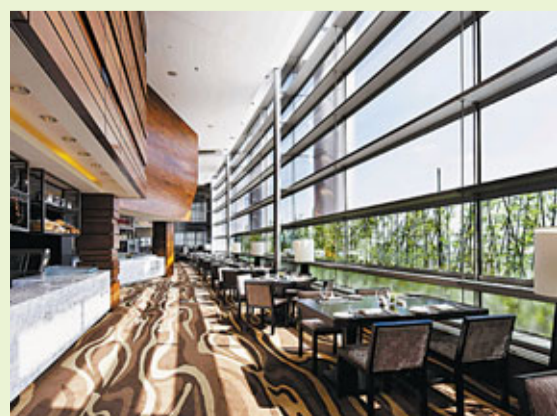
■南京綠地洲際酒店餐廳

在樓宇設計佈局方面，紫峰大廈的主樓隨着平面的上升結合立面造型，而依次逐漸收分，創造出豐富的室內外空間。副樓平面呈梯形，與整體建築形象、商業中庭有機整合，與主樓相呼應。辦公或酒店客房沿塔樓平面周邊佈置，取得最大的採光面和景觀價值。裙房結合用地條件呈不規則造型並與相應的道路平行，有機地解決了商業利用率和城市的關係問題。在室內設計方面，辦公區電梯廳天花採用全新的超白絲網印刷玻璃節能發光吊頂，樓道均採用LED節能照明設備，區域牆面為可麗耐人造石、不銹鋼條組合，取代了天然石材對資源的消耗。此外，大廈的空調系統選用了世界領先的VAV變風量全空氣空調系統，結合水冷系統、熱交換系統、新風系統等設備保持室內恆溫恆濕。整個建築的室內用料不僅環保而且兼顧了建築超五星的設計標準，舒適宜人且效果美觀。