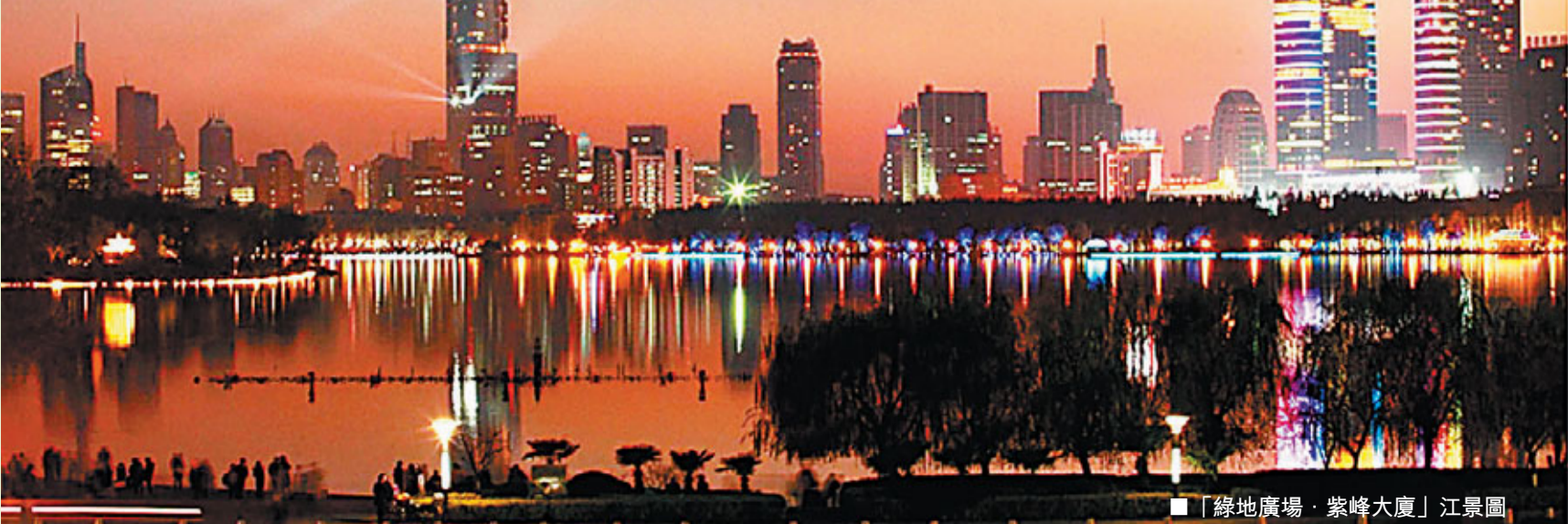
■「綠地廣場·紫峰大廈」江景圖

下建築，面積達61000平方米，作為商場、停車及設備機房，配備的機動車位超過1000個，方便了車輛的出入及停放。大廈還與城市地鐵相連，在設計時充分考慮到軌道交通予人們所帶來的迅捷和便利，根據主要人流方向，商業區入口、酒店入口、主樓辦公入口、副樓辦公入口均設計，佈置在了相應的道路上，真正做到了以人為本的綠色便捷性設計。