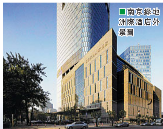
■南京綠地洲際酒店外景圖

在交通組織方面，紫峰大廈不僅佔據南京最繁華的城市中心地段，同時充分考慮了客流出行的順暢。沿中山北路設有主樓辦公樓入口，在主樓與副樓間的商業中庭與商務中心的中庭形成視覺通廊。在規劃道路上，大廈開設辦公副樓入口、商業入口和酒店車道入口，每個不同功能的入口均設有地下車庫出入口，與之相配套的是4層式設計的地