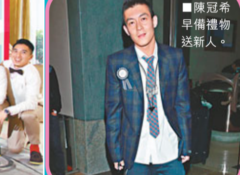
陳冠希早備禮物送新人。