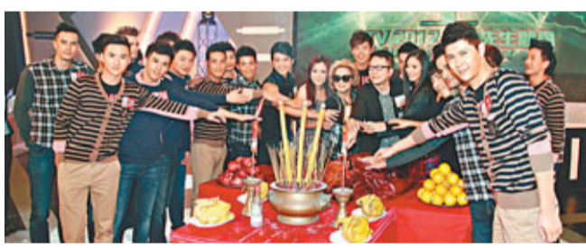
一眾嘉賓及入圍選手一同切燒豬,祈求總決賽一切順利。

另一邊廂,今屆亞洲先生競選總決賽今晚舉行,一眾入圍參賽者近日均忙於排練及準備決賽之餘,亞視昨日為節目進行拜神儀式,祈求節目拍攝順利。出席的嘉賓包括亞