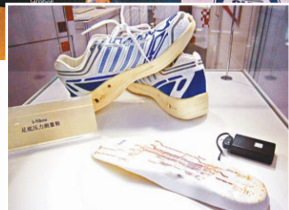
■香港公司推出的帶有傳感器的運動鞋,可監測血糖和運動員跑步姿勢正確與否。

香港紡織及成衣研發中心與香港一醫院聯合研發推出的i-shoe,鞋底有傳感器,可以監測糖尿病人的血糖數據,檢查運動員跑步姿勢是否正確,目前其正尋找合作商對產品進行二次開發。此外,一款3D數碼試衣鏡也吸引了很多人的目光,只要站在一塊「試衣魔鏡」前,愛美的女性不用一遍遍地取、脫、換、穿每件衣服,就可以看到自己真實的3D試衣效果。模特在虛擬試衣間換一件衣服只需短短一秒。