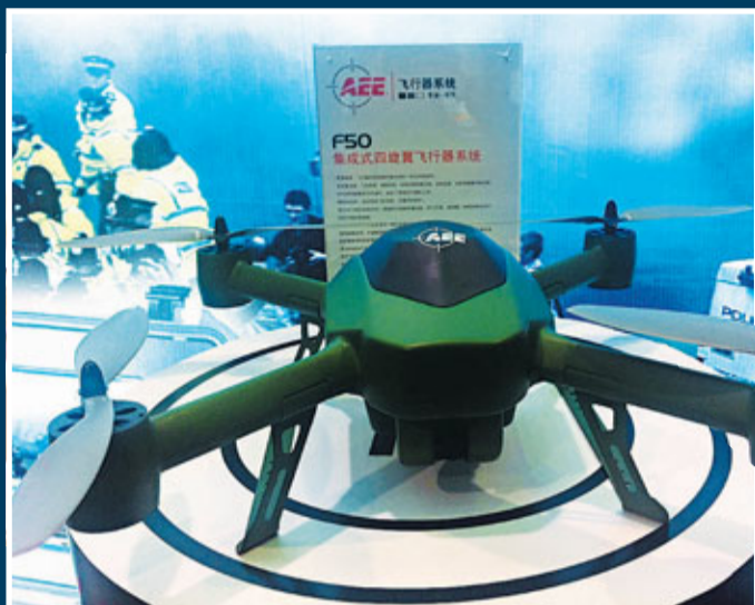
■F50四旋翼無人機助力交通監管。