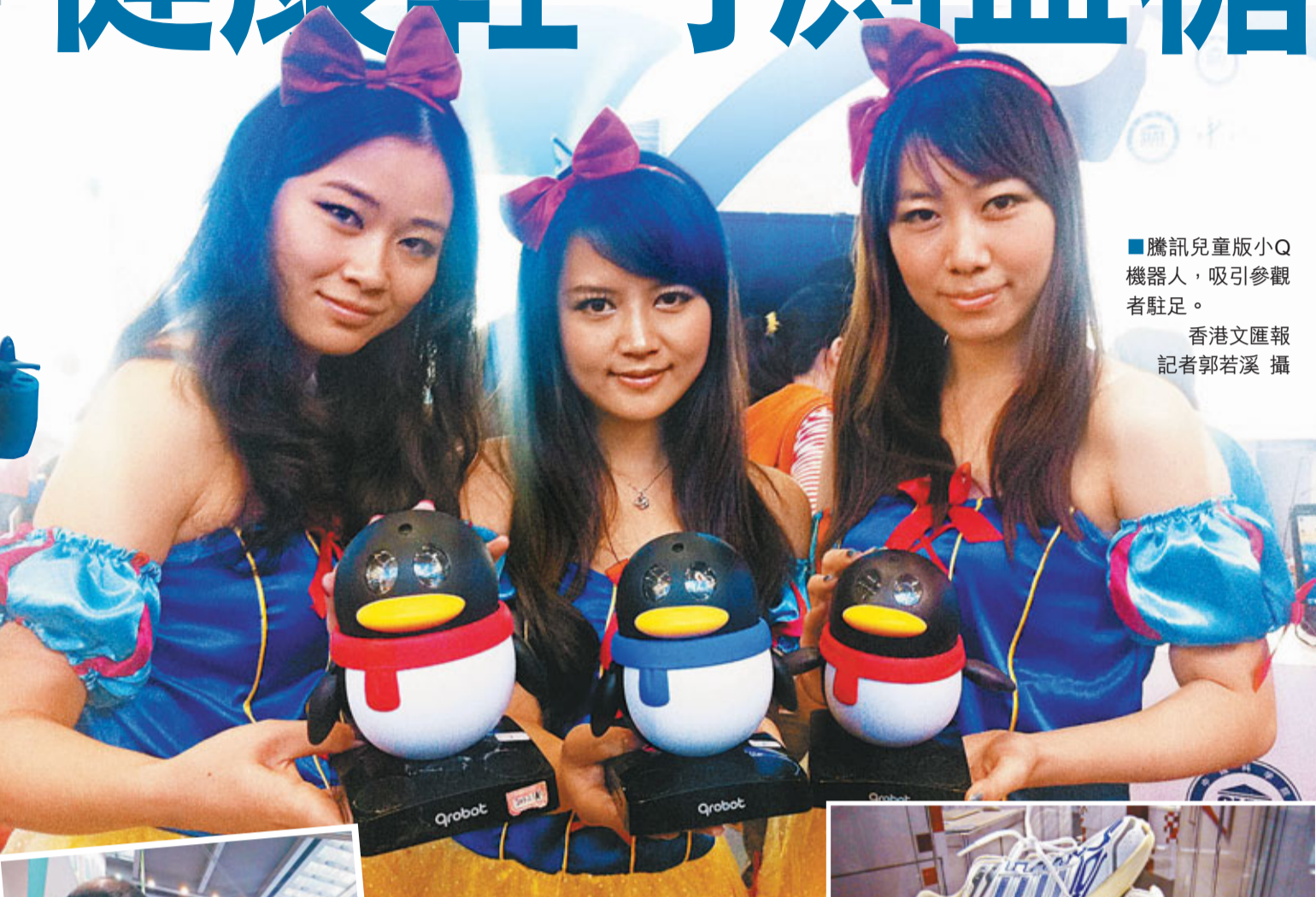
■騰訊兒童版小Q機器人,吸引參觀者駐足。