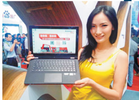
■聯想推出的360度旋轉的平板電腦,受到不少消費者青睞。