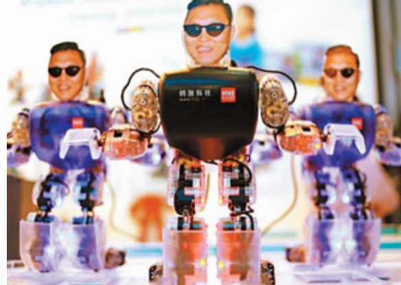
■機器人跳江南style。