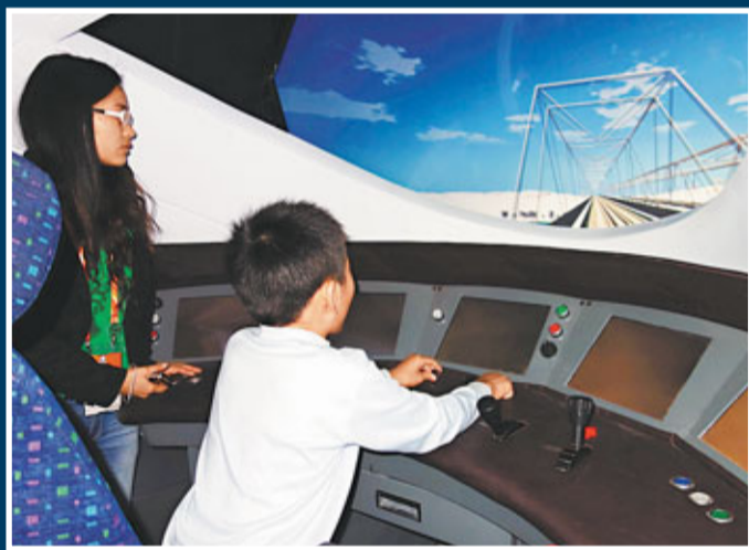
■在高交會6號館裡,市民可體驗駕駛動車的樂趣。