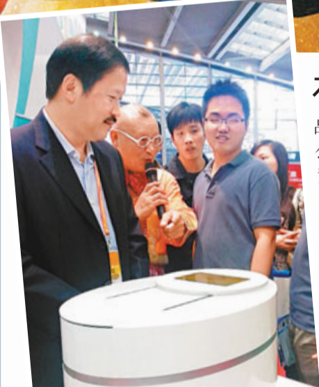
■本斯電器全球首推遙控電飯煲,可遠程發出指令自動煮飯。

在此次高交會上,可讓人感受到許多創新性的科技產品的魅力,其中有很多新產品更是全球首創的。深圳本斯智能電器有限公司發佈一款徹底顛覆廚房家用電器概念的驚世之作——雲智能遠程可控一體化家電BNW遙控智能電飯煲,就是全球首創的。用戶不論身處何方,即便是遠在國外,無論距離多遠,只需通過手機、電腦、平板遙控便可實現儲米、量米、送米、洗米、加水、排水、煮飯、褒粥等一體化功能以及智能控制等先進的技術應用,這種通過網絡終端輕鬆實現遠距離煮飯的夢想,顛覆了人類進入文明社會以來,煮飯仍以手工操作的繁雜流程。