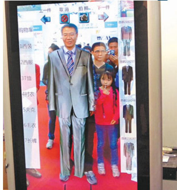
▲3D數碼試衣鏡實現一秒快速換衣。