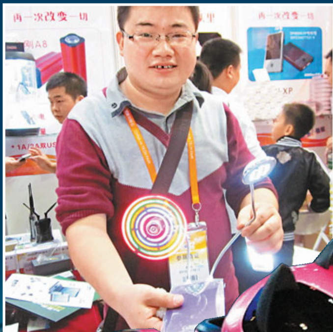
■潘多拉移動電源工作人員向記者展示產品的多種用途。