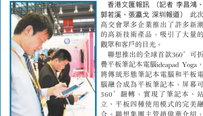
■4G上網卡產品吸引了許多客戶的目光。