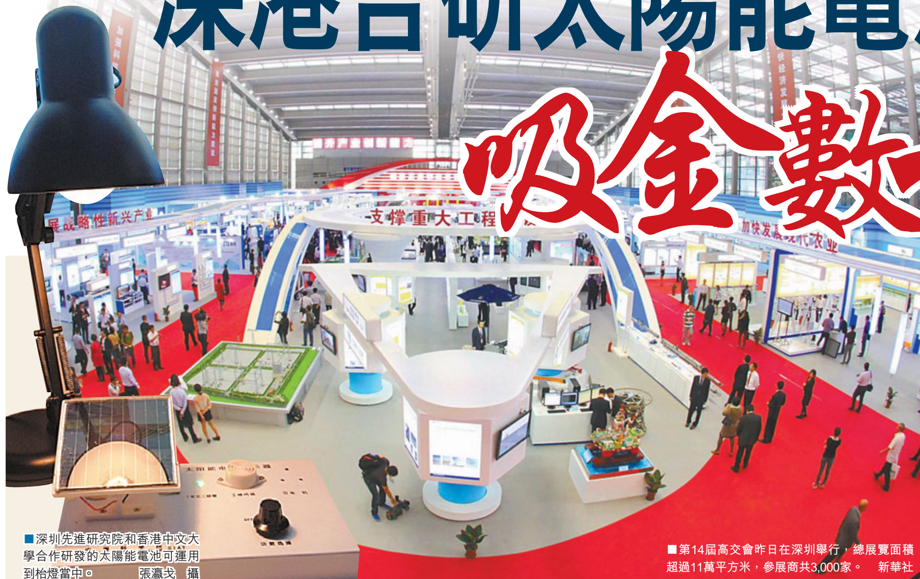
■深圳先進研究院和香港中文大學合作研發的太陽能電池可運用到枱燈當中。