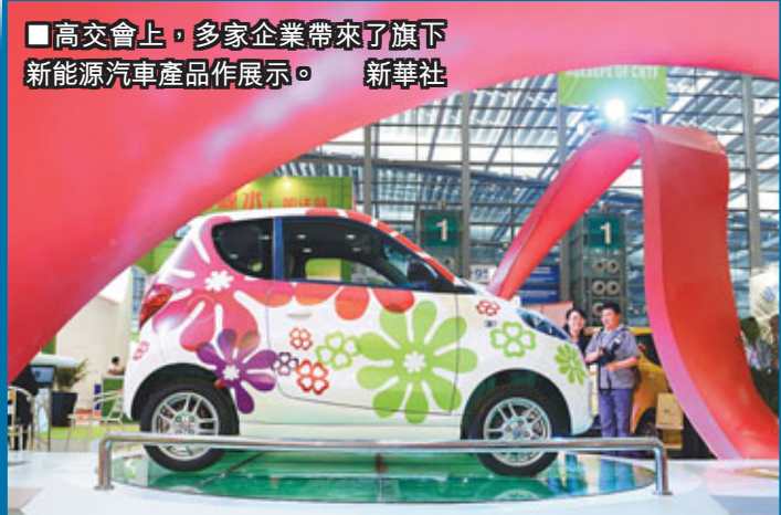
■高交會上，多家企業帶來了旗下新產品展示。