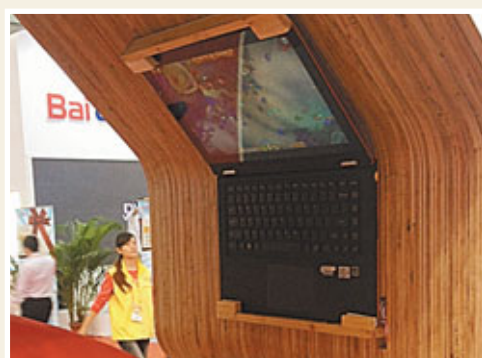
■聯想推出360度旋轉平板電腦吸引了客戶眼球。