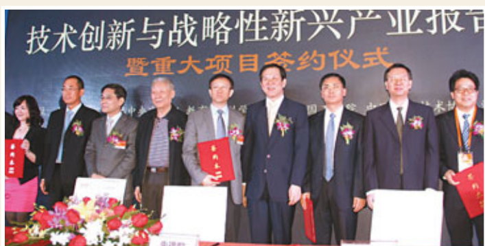
■深港合作研發太陽能電池新技術獲數十億投資，圖為簽約現場。