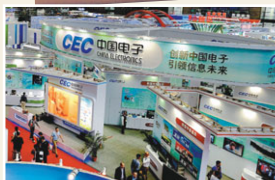
■本屆高交會共提供5個百萬以上年薪的高端職位，逾8,100名中高級人才進場交流洽談。

作為香港創新署旗下的香港應用技術研究院，通過與珠三角廣大港企等合作，進行汽車、資訊、納米、物流和紡織等多個領域的研發，獲得了不少最新科技成果。在此次展示中，納米及先進材料研發院有限公司與珠三角一港企合作研發，推出了納米鏡面金屬表面處理技術，不但沒有巨大的環境污染，還可以降低電鍍成本。而香港物流及供應鏈管理應用技術研發中心有關人士介紹，其與香港海關合作，研發了先進的電子鎖技術，對口岸過境貨車實現全面監控，將以往過關需2小時縮短至僅五分鐘，未來將推廣這一技術。此外，香港汽車零部件研究及發展中心選推出快速電池充電技術，在一小時內可將電池充20%-95%，目前其正與珠三角一車企合作。