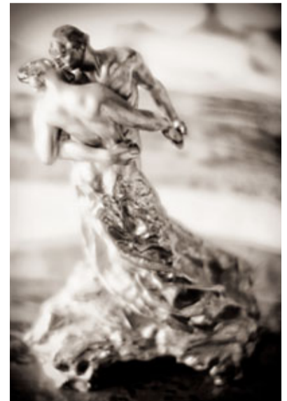
德彪西私人藏品，卡米耶·克勞岱爾作品《華爾茲》。