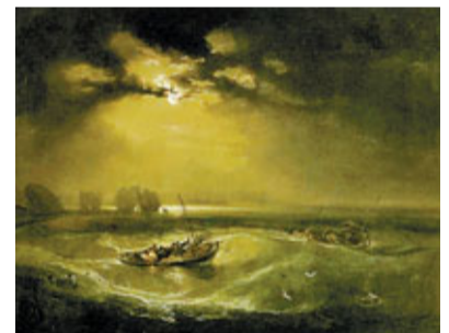
透納的《Fishermen at Sea》(1796)