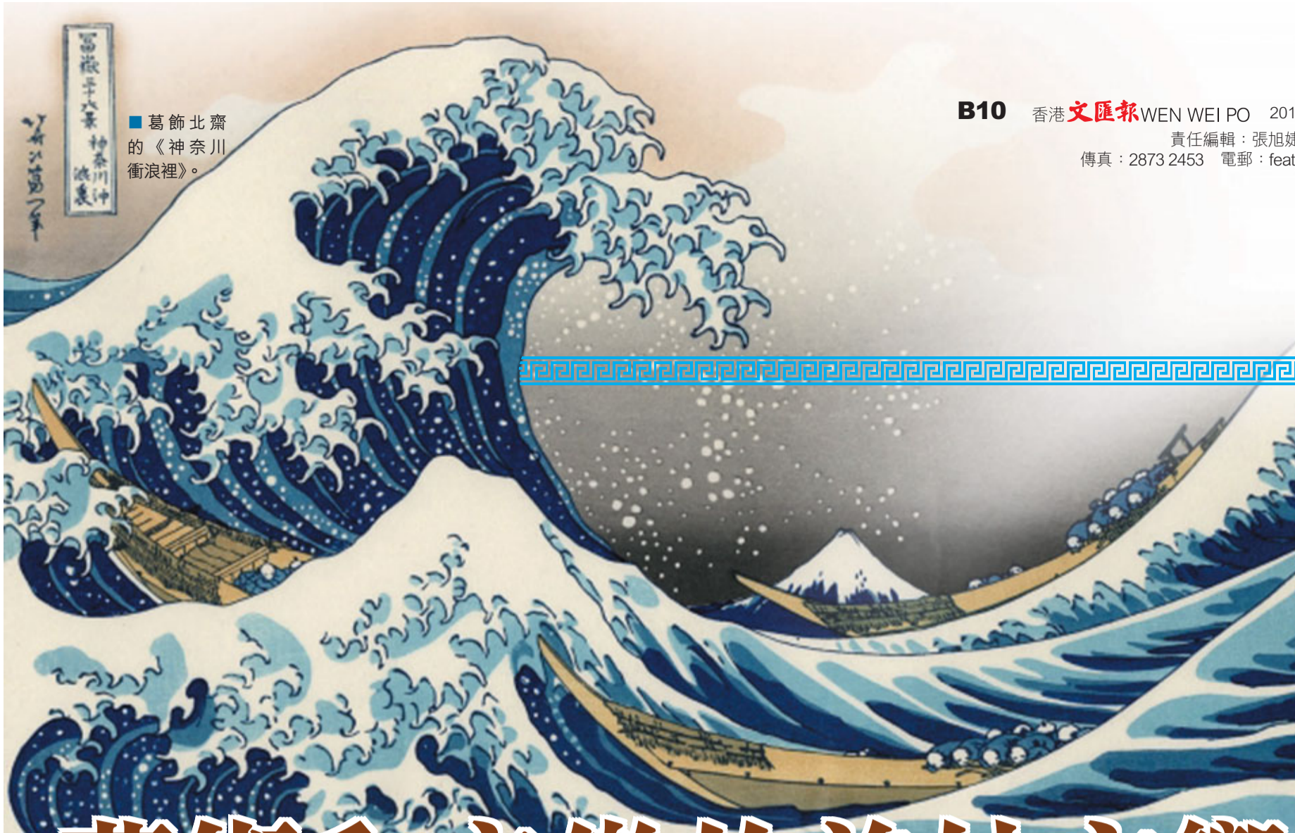
葛飾北齋的《神奈川衝浪裡》。