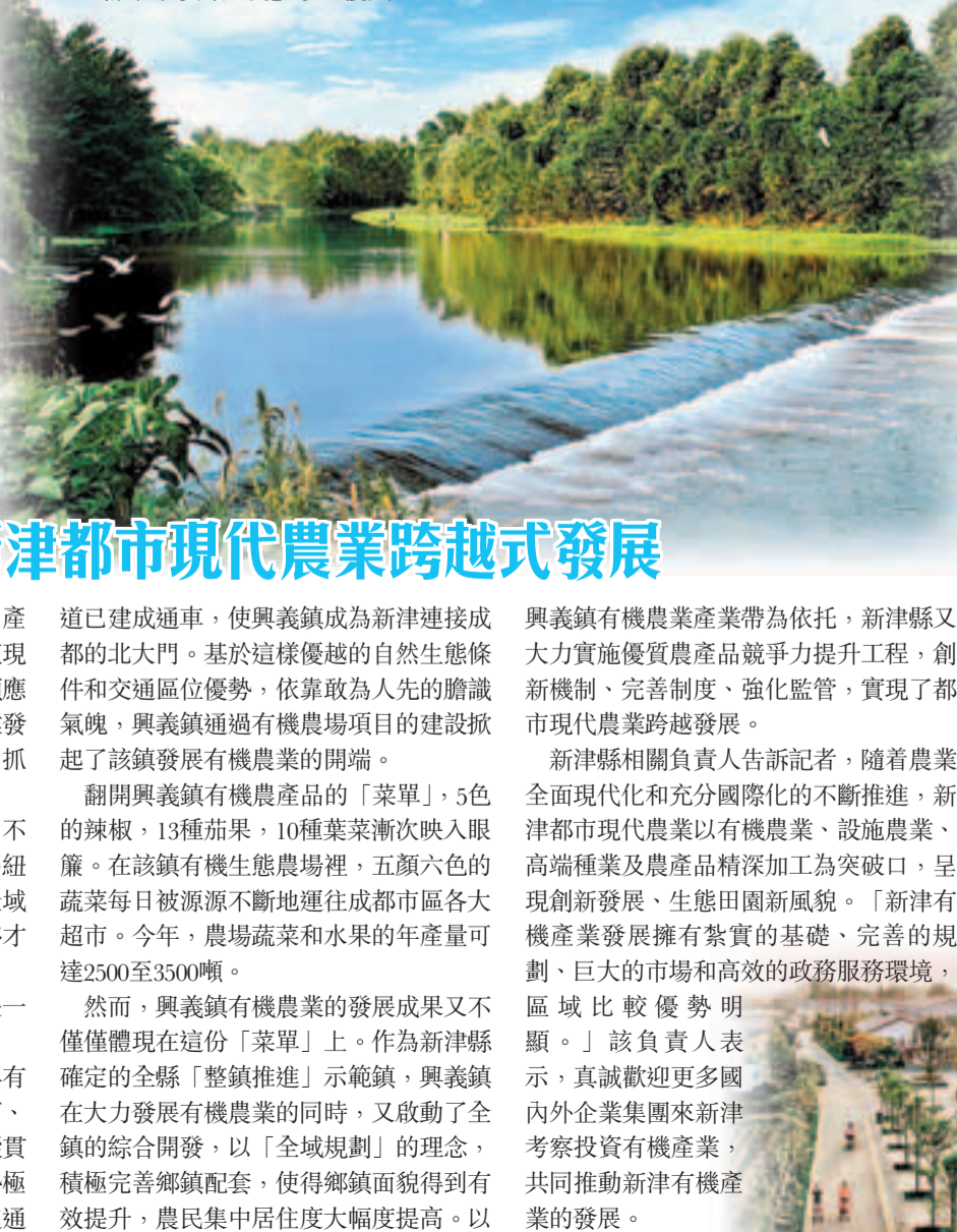
■新津「水鄉興義」景色優美

縱觀新津有機農業的發展，興義鎮是一個十分典型的案例。從先天優勢來看，興義鎮具有眾多與有機農業發展相匹配的良好條件：金馬河、石魚河、羊馬河、西河四河自北向南縱貫全鎮，水資源極為豐富；交通区位优势極為凸顯，新崇路貫穿全境，成新蒲快速通