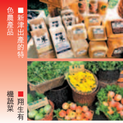
■新津出產的特色農產品 機蔬菜