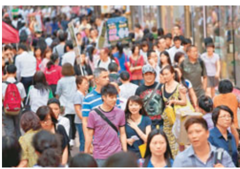
■有調查發現,港人平均需要153萬港元年薪才會感到快樂,要求高於全球平均的125萬元,亦僅次於迪拜及新加坡。