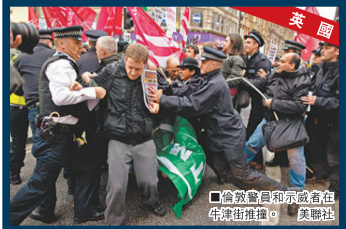
倫敦警員和示威者在牛津街推撞。美聯社