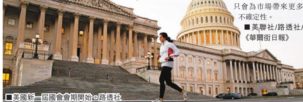
美國新一屆國會會期開始。

美國財政部前日發表報告指，聯邦政府將帶着1,200億美元(約9,301億港元)赤字踏入2013年財政年度，意味美國明年很可能會連續第五年超支逾1萬億美元(約