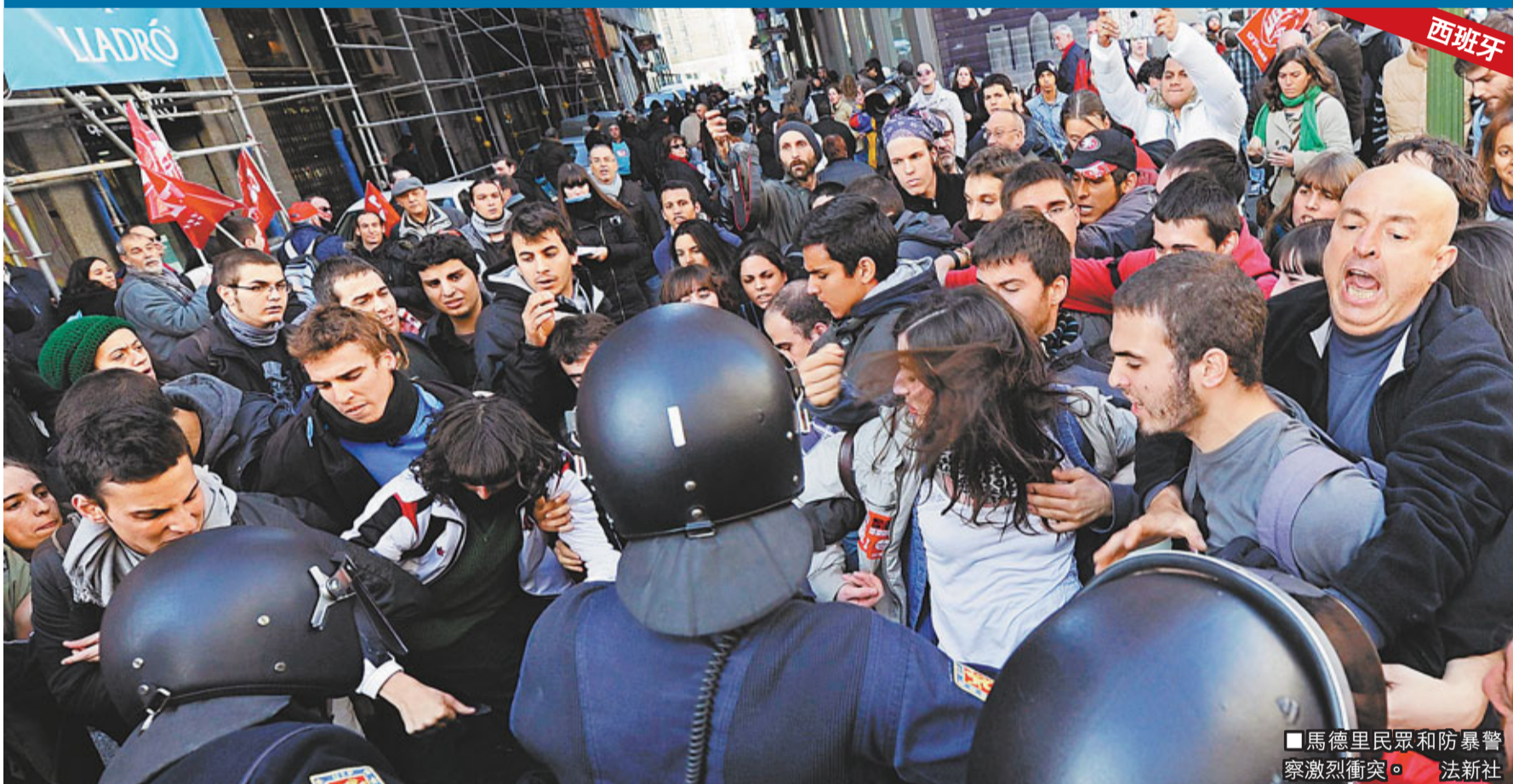
都靈警員向示威者發射催淚彈。