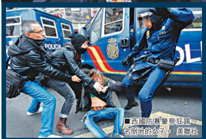
西國防暴警察狂踢一名倒地的女子。