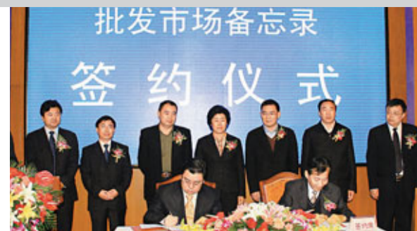
農業部副部長陳曉華(簽約席右)與甘肅省副省長冉萬祥(簽約席左)在京簽署合作。

此外,嘉里於秦皇島「海碧台」住宅項目於9月底開售以來,第一期推出300多個單位,面積介乎58至355平方米,至今已逾百個單位獲認購,預計2015年交付。