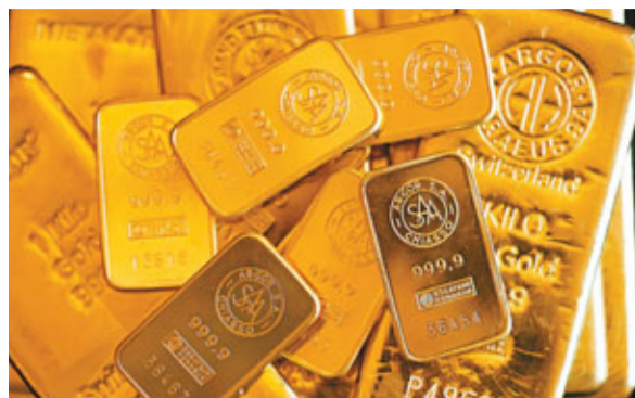
金價上周升3.3%,為1月20日以來最大單周漲幅。資料圖片

投資者押注美國總統奧巴馬成功連任後將沿用當前政策,財政懸崖問題也促使市場人士擔憂美國經濟增長可能面臨新的阻力,加上歐元區經濟前景的擔憂也提升了金價。此外,近一個月來金價的跌勢引發了對實物黃金的逢低買盤,尤其是在亞洲,印度今日起為期5天的排燈節假期,導致印度對黃金需求強勁增長。