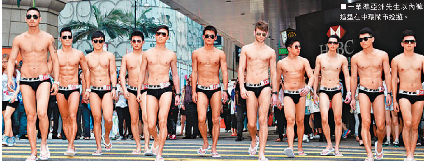
一眾準亞洲先生以內褲造型在中環鬧市巡遊。