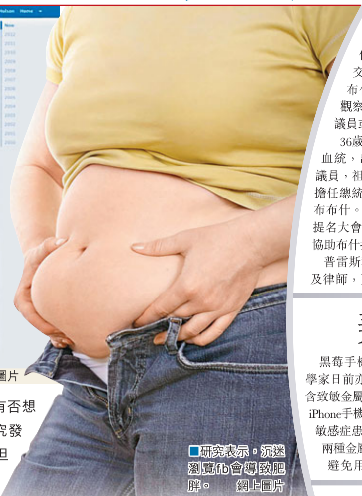
研究表示，沉迷瀏覽fb會導致肥胖。網上圖片

該名為「親朋密友是敵人？社交網絡、自尊和自制」的研究，由美國哥倫比亞大學副教授威爾科克斯及匹茲堡大學副教授蒂芬負責。他們向美國541名fb用戶發出網上問卷，探討每天瀏覽fb時間、好友人數、財政狀況及暴飲暴食頻率。調查發現，用戶愈沉迷fb，身體質量指數(BMI)較高，更易暴飲暴食、信用卡卡數較多及信用評分較低。研究員其後要求受訪者上網或使用fb 5分鐘，然後用iPad參