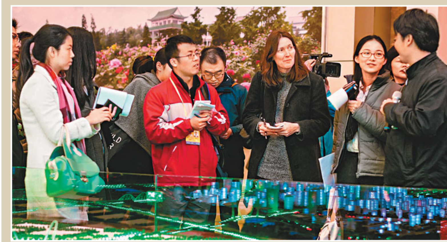
■ 境外記者日前在北京走訪首鋼老廠區，參觀「新首鋼高端產業綜合服務區」規劃沙盤。 新華社

西班牙外交與合作大臣馬加略在專訪中表示，中國已經是世界第二大經濟體，在世界和平與國際事務中發揮了重要作用。談到十八大報告中提出中國將在2020年全面建成小康社會、實現國內生產總值和城鄉居民人均收入比2010年翻一番的目標對國際社會的影響時，馬加略說，這不僅對中國具有重大意義，對世界其他國家也將產生重要影響。