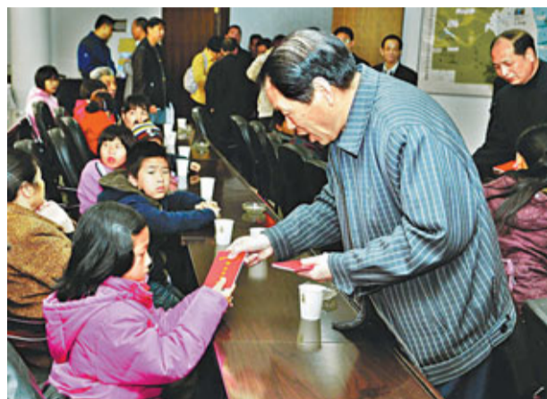
■受到福州市慈善總會救助的孤兒，一直救助到16歲，每年每人獲得慈善救助金1000元人民幣。