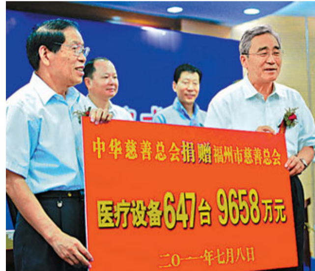
■中華慈善總會陽光醫療設備捐贈贈送

另據悉，福州市慈善總會亦通過開展「慈善文化百場電影宣傳年活動」，在福州市13個縣(市)區的100個基層鄉村、社區巡迴播放影片，宣傳福州市慈善工作與慈善活動內容，有4萬多名觀眾接受教育；通過組建慈善藝術團，以快板、評話、短劇等慈善節目推廣《慈善三字經》和慈善十大理念，將慈善理念、慈善文化等宣傳進社區、進農村、進學校；通過舉辦「與愛同行」慈善文化攝影展、創辦《海西慈善》刊物、舉辦慈善事業研討會、開設慈善講座等形式，深入靜流地傳播慈善文化。