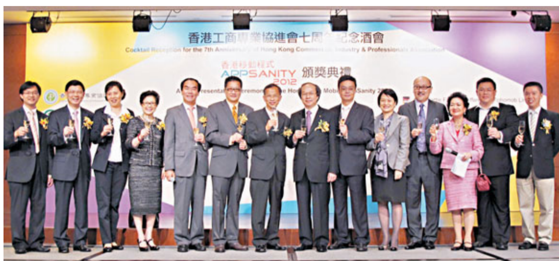
香港工商專業協會慶祝創會7周年，賓主合影。

「香港移動程式 APPSANITY2012」比賽由香港工商專業協會、香港文化教育交流協會(籌委會)以及 SINO Dynamic Solutions Limited 合辦，吸引了來自內地、香港、印度、馬來西亞、日本等地的總共957位編程愛好者的參與，共提交1,956個參賽註冊程式。