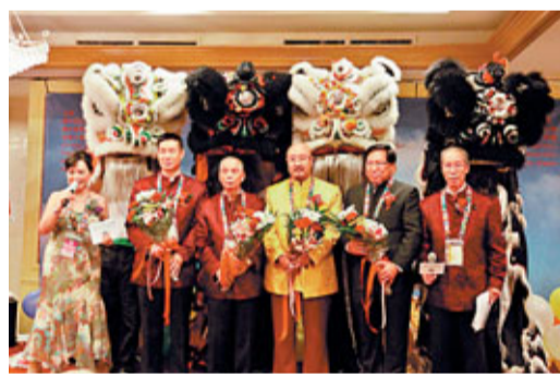
世界和平祈禱大會美國開幕舞獅慶典