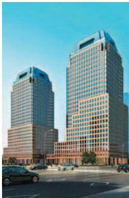
■寶安區中小企業總部大廈效果圖

據悉寶安的目標是，到今年年底，新增加先驅型企業總部企業15到20家左右，為轉型升級奠定堅實的基礎。