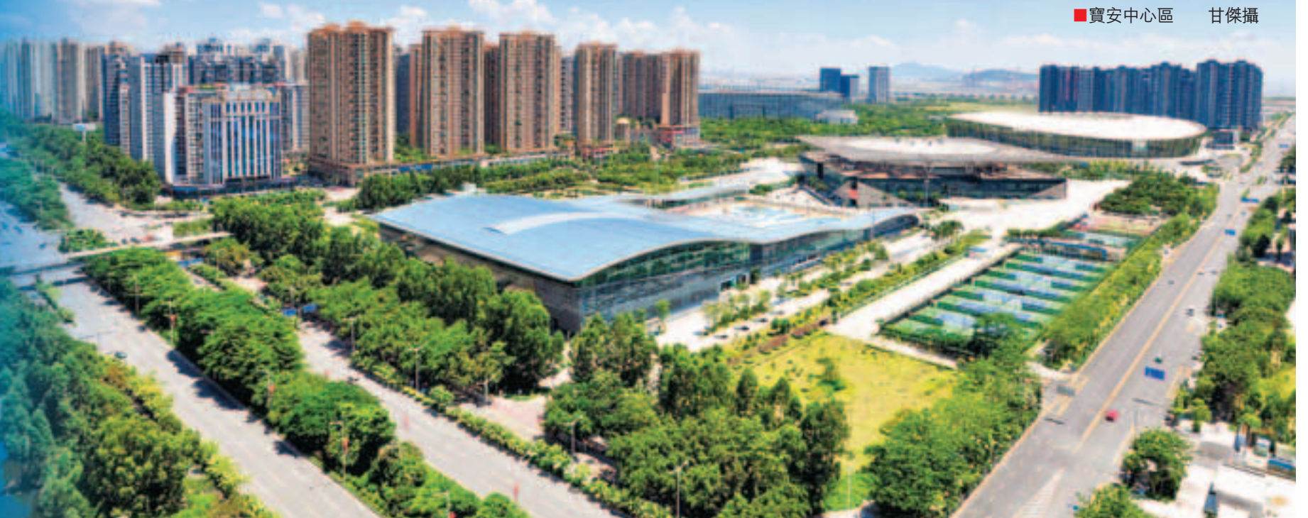
■寶安中心區

在有了憂患意識之後，寶安區迅速出手，多項措施出台引人注目。今年1月份，寶安區委、區政府將2012年確定為「轉型升級年」，寶安區委書記魯毅提出，要推動先進製造業與現代服務業「雙輪驅動」，新興產業增量與支柱產業存量「雙量提升」；內需與外需「兩需並重」，大型企業與中小企業「兩翼齊飛」，搶佔現代產業制高點，打造戰略性新興產業基地、區域性服務和創新中心。