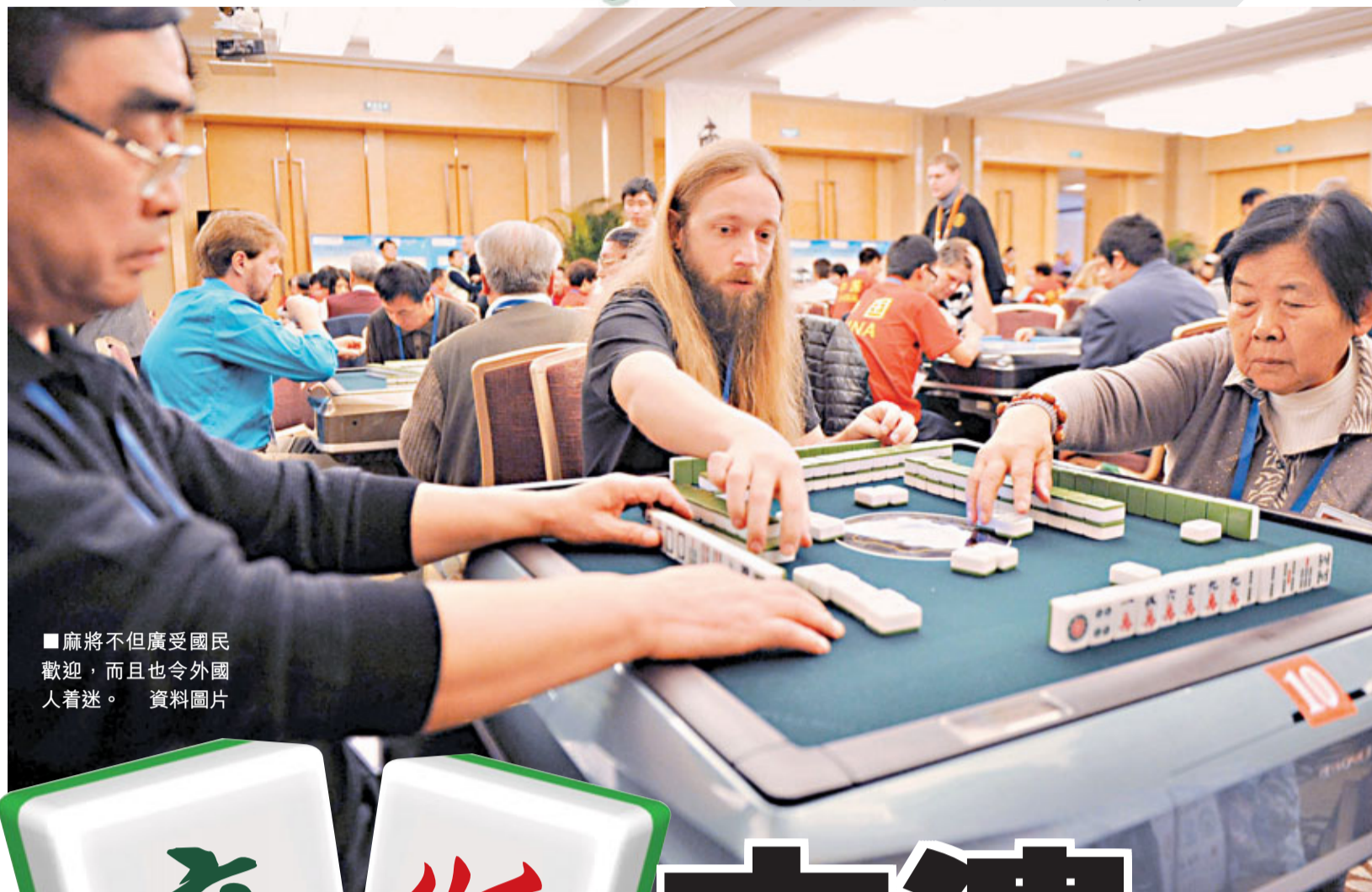
■麻將不但廣受國民歡迎，而且也令外國人着迷。