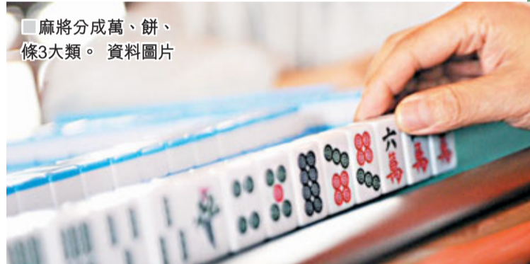
■麻將分成萬、餅、條3大類。資料圖片

近日，國家文化部非物質文化遺產專家委員會副主任、中國民俗學會理事劉魁立表示，麻將能否被納入「國家級非物質文化遺產名單」(The National List of Intangible Cultural Heritage)，當局仍需時間考慮。